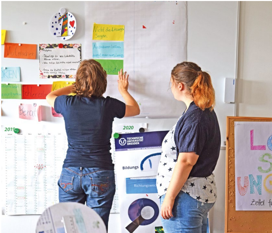
Quabis-Projekt (Standort TU Dresden)