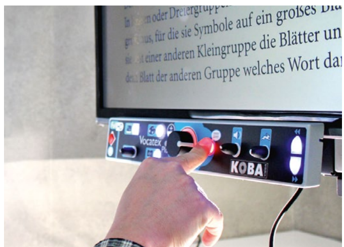
Bildschirmlesegerät an der HTWK in Leipzig

An der Hochschule für Technik, Wirtschaft und Kultur Leipzig wurden in der Hochschulbibliothek zwei Arbeitsplätze für Nutzer*innen mit Sehbeeinträchtigungen ge-