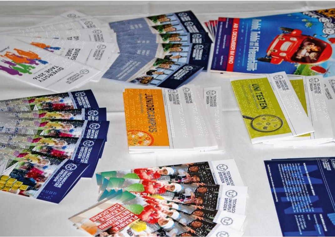
Flyer mit Brailledruck an der Technischen Universität Dresden

Beschäftigte. Auch die Angebote der Arbeitsgruppe „Studium für blinde und Sehbehinderte“ (AG SBS) konnten durch die Sondermitteln Inklusion ausgebaut werden. Die Arbeitsgruppe unterstützt Studierende mit Sehbeeinträchtigungen an der Technischen Universität Dresden in ihrem Studium. Zugleich steht die AG SBS auch für Anfragen aller Hochschulangehörigen als Accessibility-Service unterstützend zur Verfügung. Um die bestehenden, vielfältigen Beratungsangebote übersichtlich und nutzerfreundlich aufzubereiten, wird derzeit eine themenbezogene digitale Beratungslandkarte entwickelt. Die Beratungslandkarte soll Ratsuchende dabei unterstützen, die für ihr Beratungsanliegen passende Ansprechperson innerhalb zu finden und liefert zugleich eine Übersicht über häufig ge-