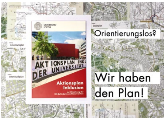
Aktionsplan der Universität Leipzig

An der Technischen Universität Chemnitz wurde bereits zweimal eine universitätseigene Studierendenbefragung zum Thema „Studium und Beeinträchtigung“ (2016, 2018) durchgeführt. Die erste Befragung von Studierenden zum