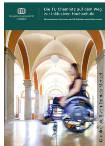
Cover des Aktionsplans der TU Chemnitz