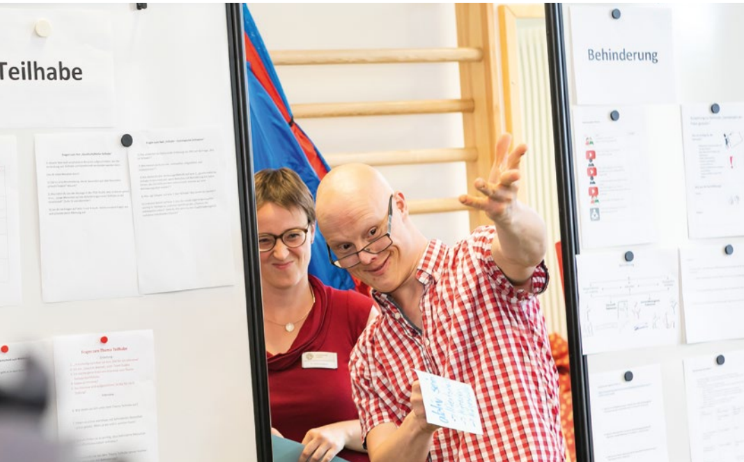
Quabis-Projekt (Standort Universität Leipzig)

ziert. Über das Projekt „Bildungsfachkräfte“ werden Menschen mit sogenannter „kognitiver Beeinträchtigung“ als Wissensvermittler*innen zur Gestaltung von Lehre an Hochschulen befähigt und ausgebildet. Im Fokus der Qualifizierungsmaßnahme steht nicht die Beeinträchtigung der angehenden Bildungsfachkräfte, sondern ihr Qualifikationsweg und damit verbunden die Chance, individuelle Potentiale an Hochschulen ungehindert einzusetzen, entfalten und nutzen zu können. Im Rahmen der Vermittlung durch die Bildungsfachkräfte an Studierende sowie Lehr-, Fach- und Führungskräfte soll nicht nur beispielhaft gezeigt werden, wie Inklusion praktisch gelingen kann, sondern wie sie als selbstverständliche Praxis im Lern- und Lehrprozess einer Universität gelebt werden kann. Vorurteile und vielfältige weitere Barrieren können durch das Projekt abgebaut werden.