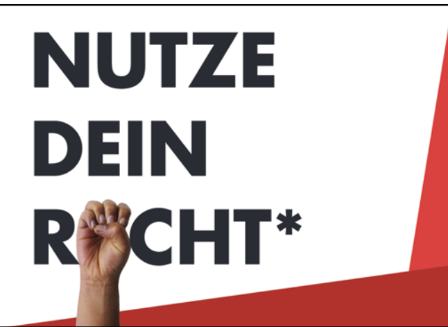
Flyer der Universität Leipzig für die Kampagne zum Nachteilsausgleich

Nachteilsausgleichen werden hochschulweit kommuniziert. Das Verfahren zur Gewährung von Nachteilsausgleichen in den Musterstudien- und Musterprüfungsordnungen für Bachelor- und Masterstudiengänge wird derzeit weiterentwickelt. Ziel ist es, das Verfahren zu Nachteilsausgleichen fakultätsübergreifend einheitlich zu regeln, um durch eine Standardisierung mehr Handlungssicherheit für die Beteiligten zu schaffen. Grundlage der Weiterentwicklung ist eine hochschulweite Abfrage bei Prüfungsausschüssen, Studienbüros sowie weiteren verantwortlichen Stellen zu Erfahrungen bei der Gewährung von Nachteilsausgleichen, regelmäßig auftretenden Problematiken sowie dem Handlungsbedarf. Im Frühjahr 2019 erfolgte schließlich eine Neustrukturierung der Beratungsangebote zum Thema Nachteilsausgleich, die im Sinne des Inklusionsgedankens eine Einbindung in die bereits bestehenden Beratungsstrukturen zum Ziel hatte. In regelmäßigen Abständen werden den Mitgliedern der Prüfungsausschüsse