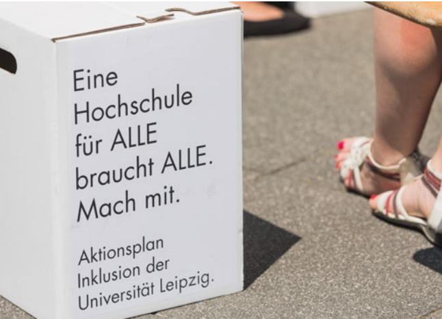
Hochschulaktionstag Inklusion an der Universität Leipzig 2018