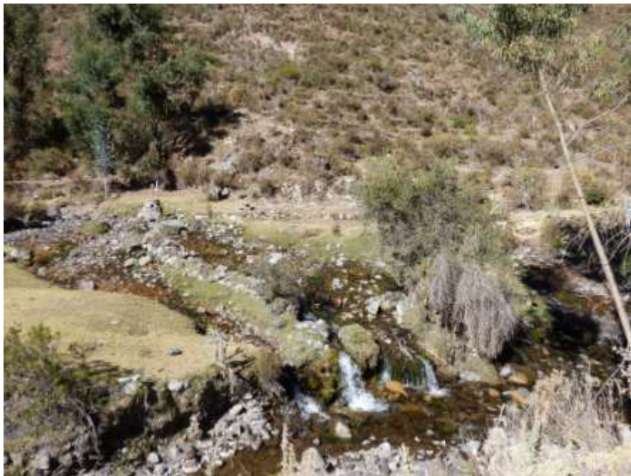
Fotografía 11: manantial Laraos

El 20/07, subimos hacia Laraos para ver y muestrear la Sima Pumacocha. Al subir, avisamos un manantial de buen caudal (manantial Laraos, Fotografía 11). Sin embargo, nos quedan pocas botellas de muestreo, y decidimos dejarlo para nuestra próxima campaña de campo.