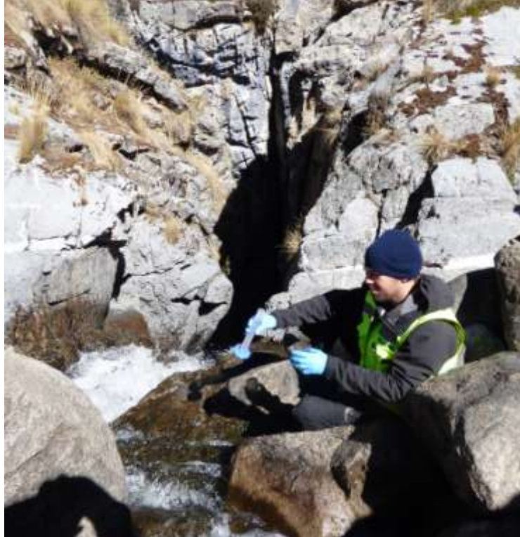
Fotografía 12: la Sima Pumacocha

El 21/07, bajamos hacia el poblado de Azucha para tomar muestras a la altura de la estación de aforo Ambiand de Azucha (Fotografía 13). Esta estación se ubica aguas debajo de la unión entre el río Cañete y el río Alis y nos permitirá estudiar la influencia del río Alis sobre la composición química del río Cañete.