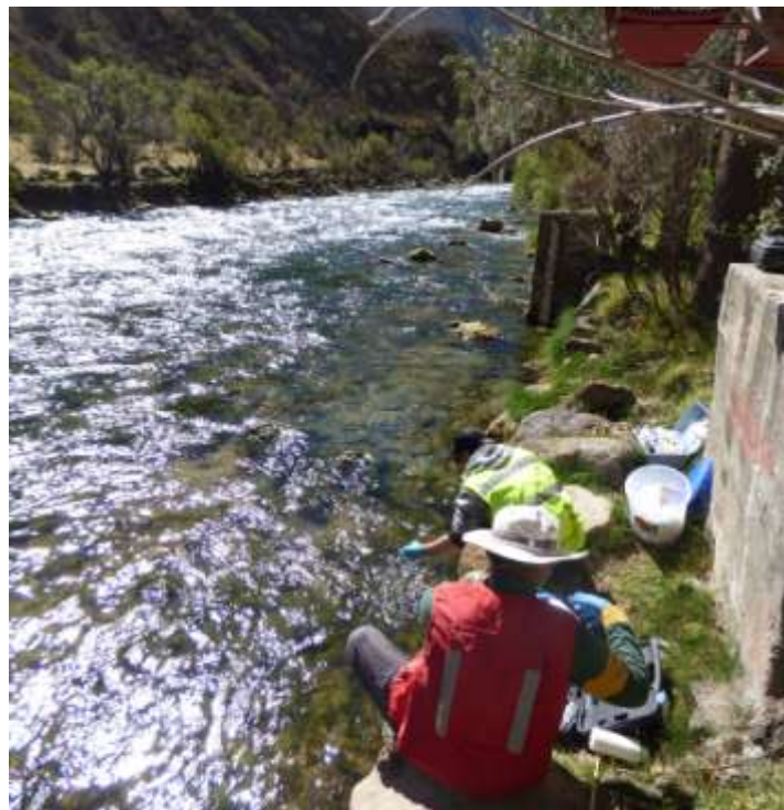
Fotografía 13: muestreo en la estación de aforo Azucha

El 21/07, bajamos hacia el poblado de Azucha para tomar muestras a la altura de la estación de aforo Ambiand de Azucha (Fotografía 13). Esta estación se ubica aguas debajo de la unión entre el río Cañete y el río Alis y nos permitirá estudiar la influencia del río Alis sobre la composición química del río Cañete.