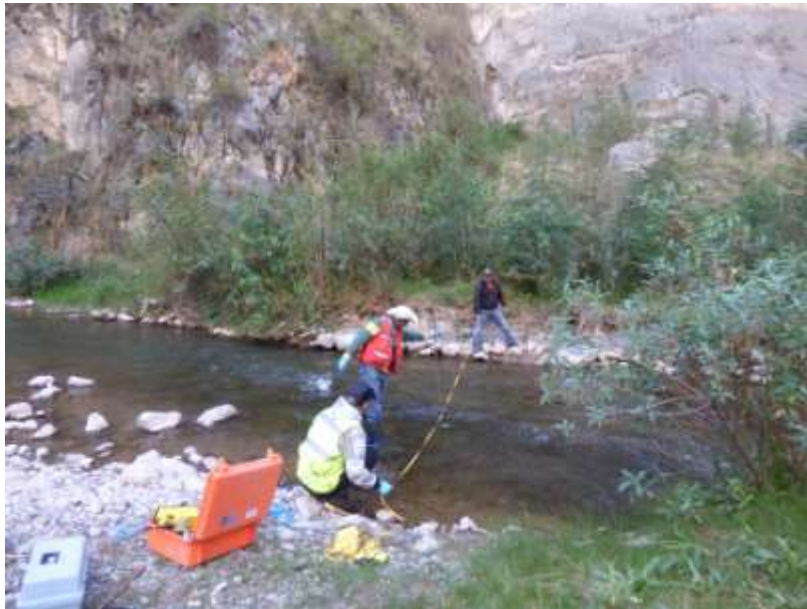
Fotografía 9: aforo del rio Alis, aguas arriba del manantial Alis

El 17/07, regresamos en el sector de Alis, con la intención de buscar puntos de aforo, aguas arriba y aguas abajo del manantial Alis, para poder medir su caudal mediante el método de los aforos diferenciales. Ubicamos 2 puntos localizados respectivamente unos 620 m aguas arriba (Fotografía 9) y 510 m aguas abajo del manantial Alis (Fotografía 10). El punto aguas abajo es el mismo que el ya muestreado durante nuestra campaña del 2015 con el IRD. El aforo de esta punto se realizó el 19/07.