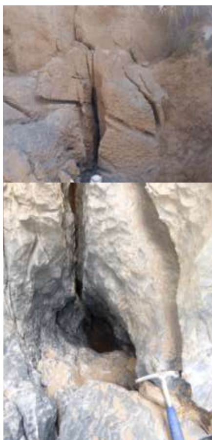
Fotografía 5: tragadero fósil

En el sector del tragadero “total”, se encuentra un cañón fósil, ya explorado en parte por nuestros colegas del ECA en junio. Encontramos 3 tragaderos fósiles (Fotografía 5), los mismos que ya fueron vistos por nuestros colegas del ECA.