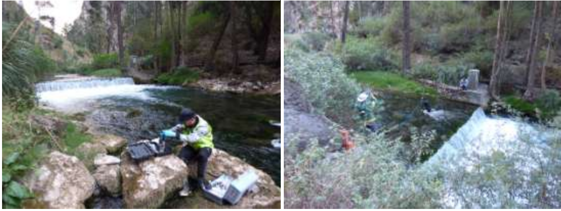
Fotografía 10: muestreo (foto izquierda) y aforo (foto derecha) del rio Alis, aguas abajo del manantial Alis

El 18/07, aforamos las 2 resurgencias del rio Cañete. El caudal acumulado de las 2 resurgencias fue estimado en 1,86 \text{ m}^3/\text{s} . El mismo día, inventariamos algunos manantiales de muy bajo caudal, en las laderas, entre Vilca y Huancaya.