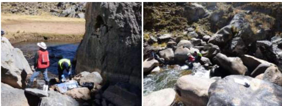
Fotografía 4: izquierda: muestreo en el tragadero “parcial”; derecha: muestreo en el tragadero “total”

En el sector del tragadero “total”, se encuentra un cañón fósil, ya explorado en parte por nuestros colegas del ECA en junio. Encontramos 3 tragaderos fósiles (Fotografía 5), los mismos que ya fueron vistos por nuestros colegas del ECA.