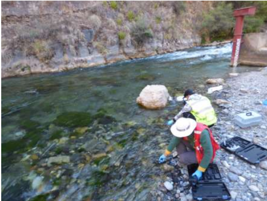
Fotografía 14: muestreo en la estación de aforo Tinco Alis

Terminamos el día, muestreando el sexto punto de control del río Cañete, en la estación de aforo de Ambiand Tinco Alis, último punto antes de la unión entre el río Cañete y el río Alis (Fotografía 14).