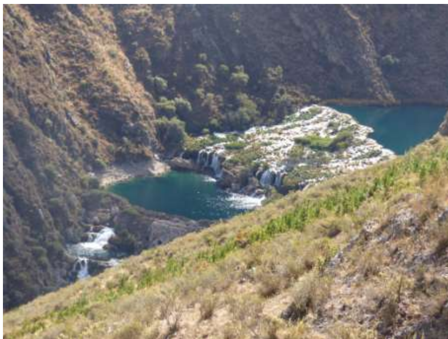
Fotografía 2: barreras de travertinos en el río Cañete, formando impresionantes cascadas

El día siguiente (12/07) subimos hacia Vilca con la intención de tomar muestras a lo largo del río Cañete, entre el pueblo de Vilca y el pueblo de Huancaya, con el fin de poder estudiar la formación de las impresionantes barreras de travertinos que se observan en este sector (Fotografía 2)