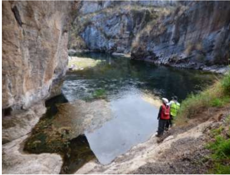
Fotografía 8: Segunda resurgencia del rio Cañete

El 17/07, regresamos en el sector de Alis, con la intención de buscar puntos de aforo, aguas arriba y aguas abajo del manantial Alis, para poder medir su caudal mediante el método de los aforos diferenciales. Ubicamos 2 puntos localizados respectivamente unos 620 m aguas arriba (Fotografía 9) y 510 m aguas abajo del manantial Alis (Fotografía 10). El punto aguas abajo es el mismo que el ya muestreado durante nuestra campaña del 2015 con el IRD. El aforo de esta punto se realizó el 19/07.