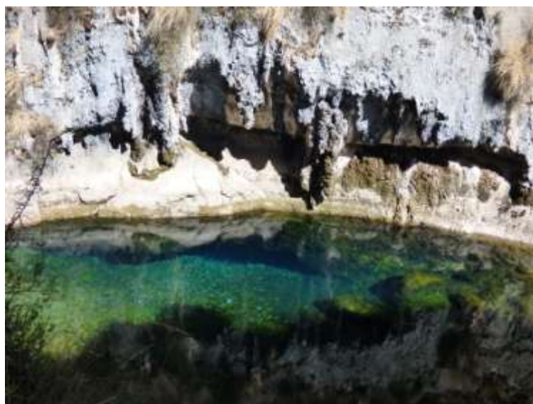
Fotografía 7: Primera resurgencia del río Cañete

El mismo día, bajamos hasta la resurgencia del río Cañete. Al contrario a lo visto por nuestros colegas del IRD en junio, encontramos no una, sino 2 resurgencias. La más grande corresponde a la descrita en el informe del ECA (Fotografía 7), pero unos 100 m antes encontramos otra resurgencia, de menor caudal (Fotografía 8). Tomamos muestras y mediciones de los parámetros físico-químicos en ambas resurgencias.