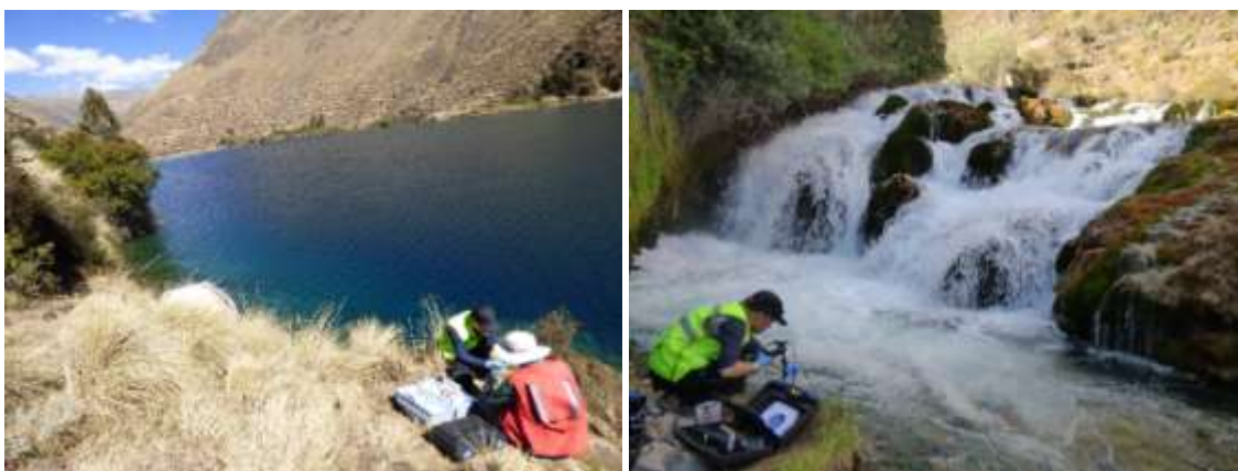
Fotografía 3: izquierda: muestreo del punto Río Cañete 2 (Laguna); derecha: muestreo del punto Río Cañete-Huancaya

Tomamos muestras de agua y mediciones de los parámetros físico-químicos a la altura de esta estación de Vilca. Bajando el curso del río, establecemos 6 puntos de control (incluyendo el punto tomado en Vilca) para estudiar la composición química del agua del río entre Vilca y Tinco Alis. Este mismo día, muestreamos el primer punto definido (denominado Río Cañete 2 (Laguna)), así como el río a la altura del poblado de Huancaya (este corresponde al 5to punto de control, denominado Río Cañete-Huancaya) (Fotografía 3)