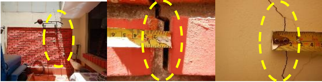
Sector Urbanización Independencia Americana, distrito Yanahuara 29/10/2020. Agrietamiento en las paredes de una vivienda.