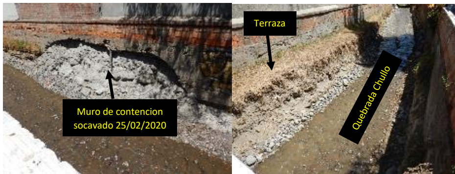
Sector Puente Primavera, distrito Yanahuara 29/10/2020. a) pared socavada por los huaicos b) Terrazas de secuencias de lahares antiguos en la quebrada Chullo.