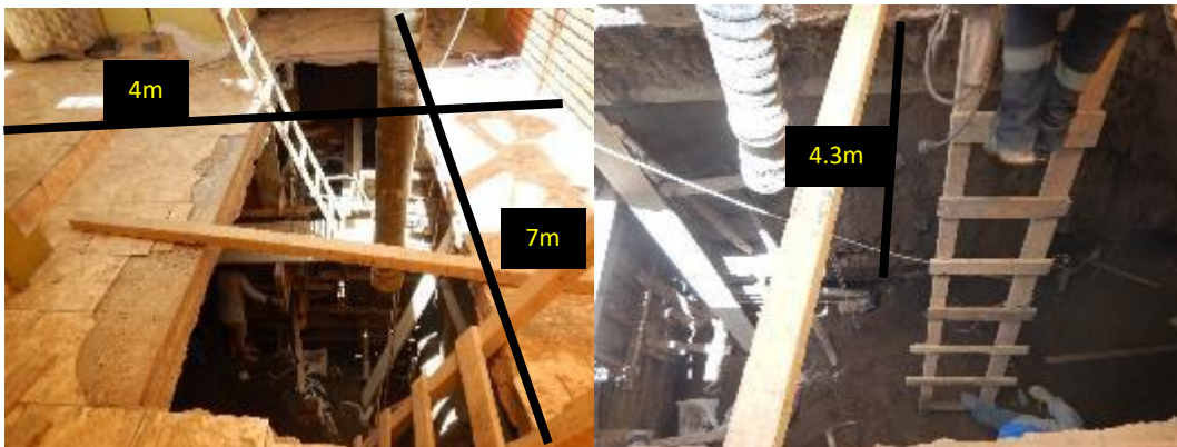
Sector Urbanización Independencia Americana, distrito Yanahuara. a) Vivienda con un forado en la cochera de largo 7m, ancho 4m y profundidad 4.3m . b) Interior del forado.