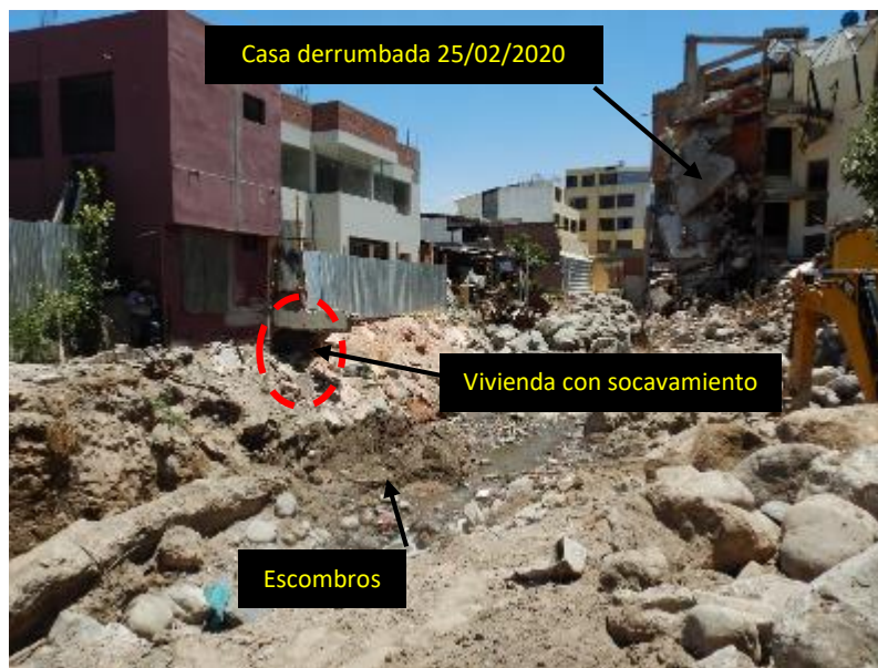
Sector Urbanización Independencia Americana, distrito Yanahuara 29/10/2020. a) Vivienda derrumbada el 25 de febrero 2020, casa con socavamiento y escombros en el cauce de la quebrada Chullo.