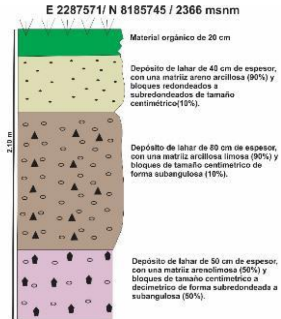
Sector, distrito Yanahuara 29/10/2020. a) Secuencia de lahares antiguos en la quebrada Chullo b) Columna estratigráfica .