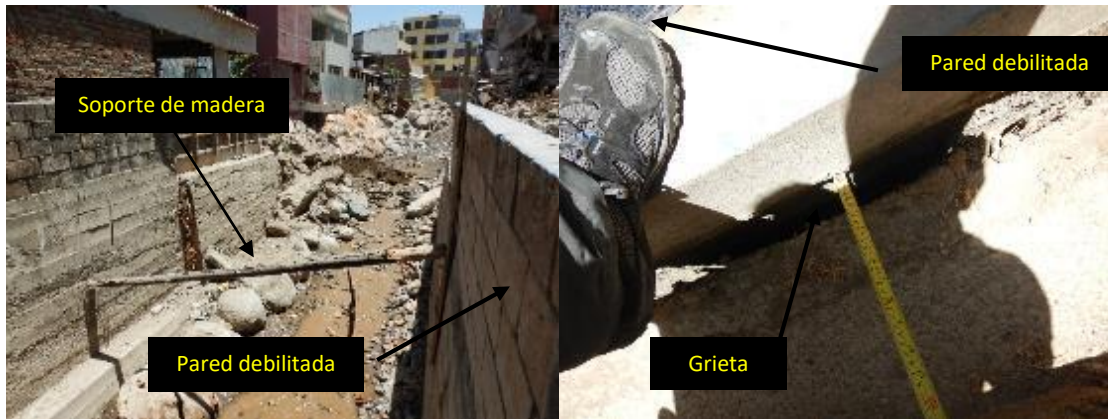
Sector Urbanización Independencia Americana, distrito Yanahuara 29/10/2020. a) Muro de contención debilitado e inclinado soportado por un pilote de madera. b) Grieta de 7 cm de ancho en el muro inclinado a lado del parque de la urbanización.