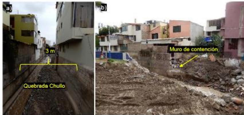
Sector Urbanización Independencia Americana, distrito Yanahuara. a) el cauce de la quebrada se estrangula a 3 m de ancho. b) muro de contención destrozado. (Informe A7040)