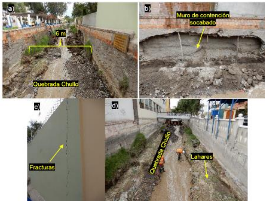
Sector Puente Primavera, distrito Yanahuara. a) muro de contención antiguo y debilitado por la erosión de los huaicos. b) pared socavada por los huaicos. c) fracturas en las paredes de las casas a causa de los asentamientos producidos por la socavación en el lecho de la quebrada. d) depósitos de lahares dentro de la quebrada. (Informe A7040).