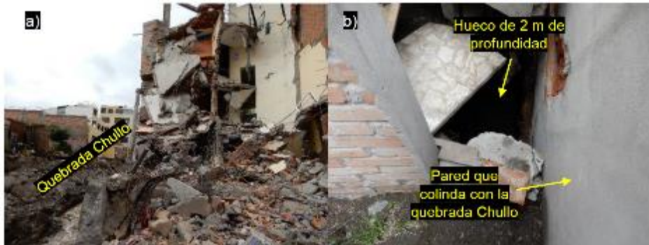
Sector Urbanización Independencia Americana afectada por huaicos. a) Casa destrozada e inhabitable, b) Patio de una vivienda a punto de colapsar, tiene un hueco de 2 m de profundidad. (Informe A7040)