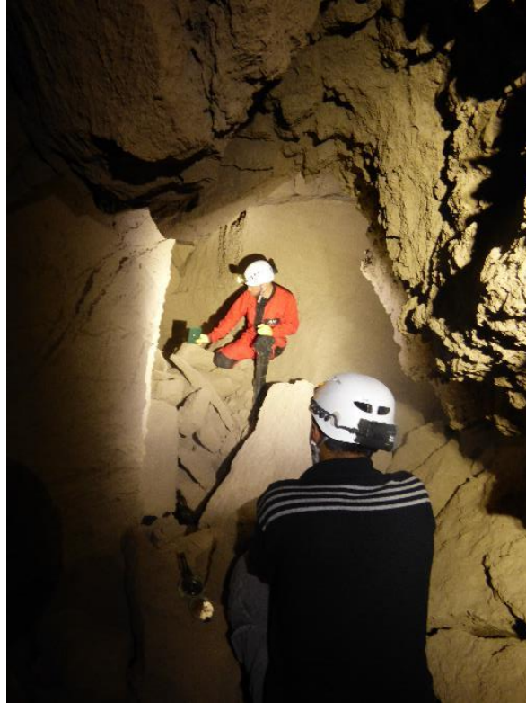
Fotografía 9: mapeo de la cueva de Masamata