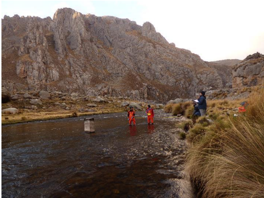
Fotografía 1: Aforo del tragadero del río Cañete

Viaje Lima-Tanta. Llegamos a Tanta el 19/09 en la tarde. Después del almuerzo, salimos hacia el manantial Muyucocha para muestrearlo. Luego nos dirigimos hacia el tragadero del río Cañete para realizar el aforo (Q: 6.32 m 3 /s) (Fotografía 1).