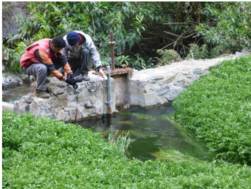
Fotografía 6: muestreo y descarga de datos del datalogger en el manantial Alis