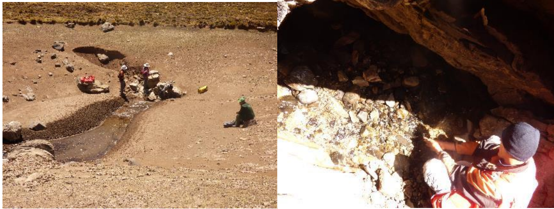
Fotografía 10: los 2 tragaderos inventariados