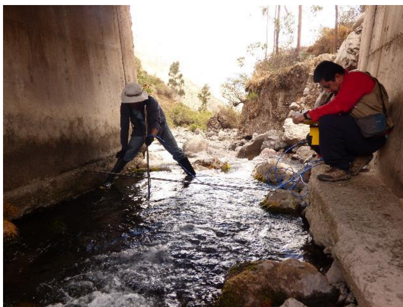
Fotografía 8: aforo del manantial Laraos