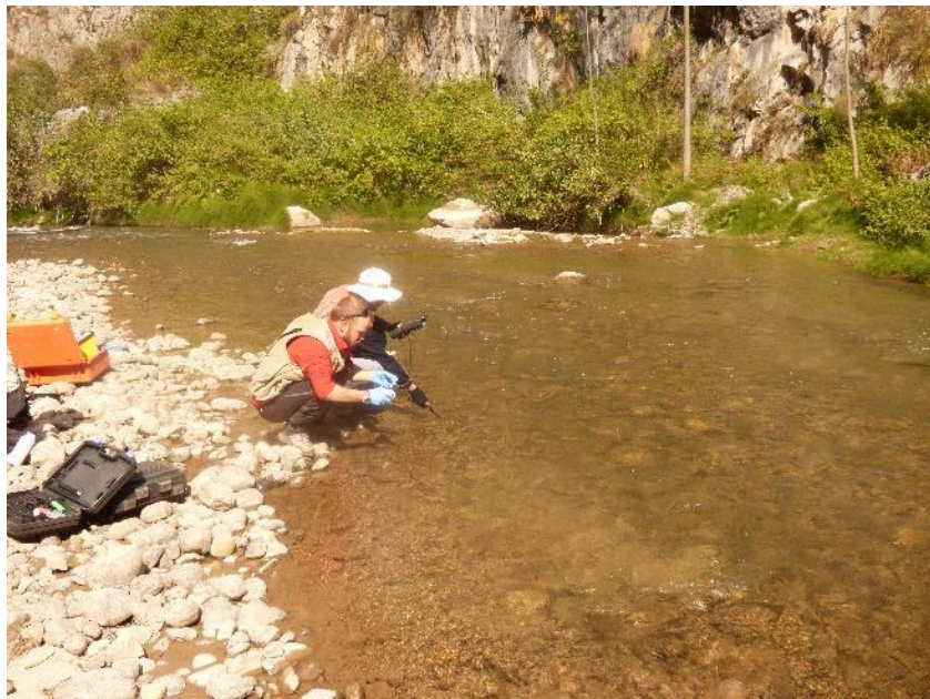
Fotografía 4: muestreo del río Alis, aguas arriba del manantial

Muestreo y descarga de los datos del datalogger instalado en el manantial Alis (Fotografía 6)