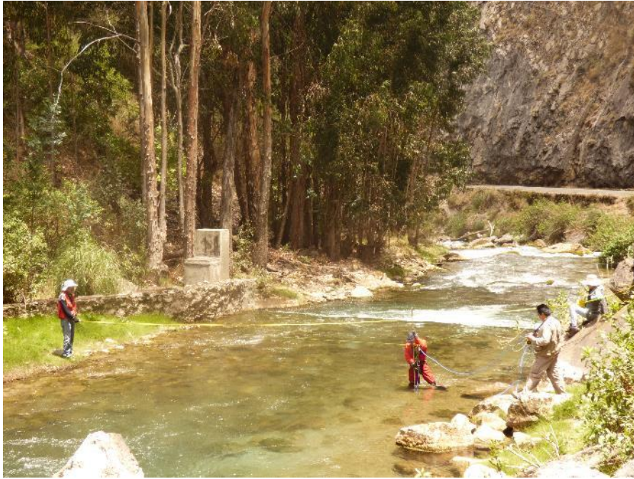
Fotografía 5: muestreo del río Alis, aguas abajo del manantial