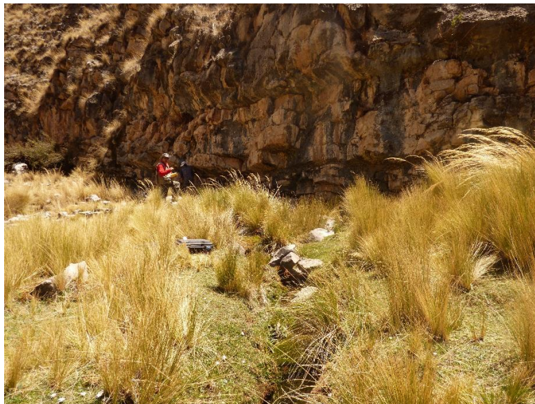
Fotografía 11: resurgencia encontrada en el sector de Azulcocha