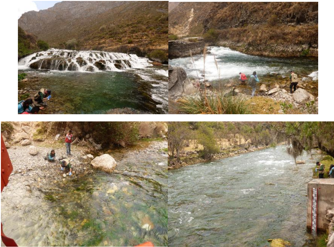
Fotografía 3: muestreo de aguas a lo largo del río Cañete