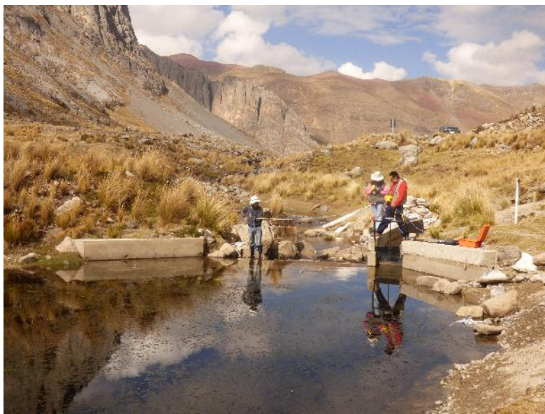
Fotografía 7: aforo de la Sima Pumacocha