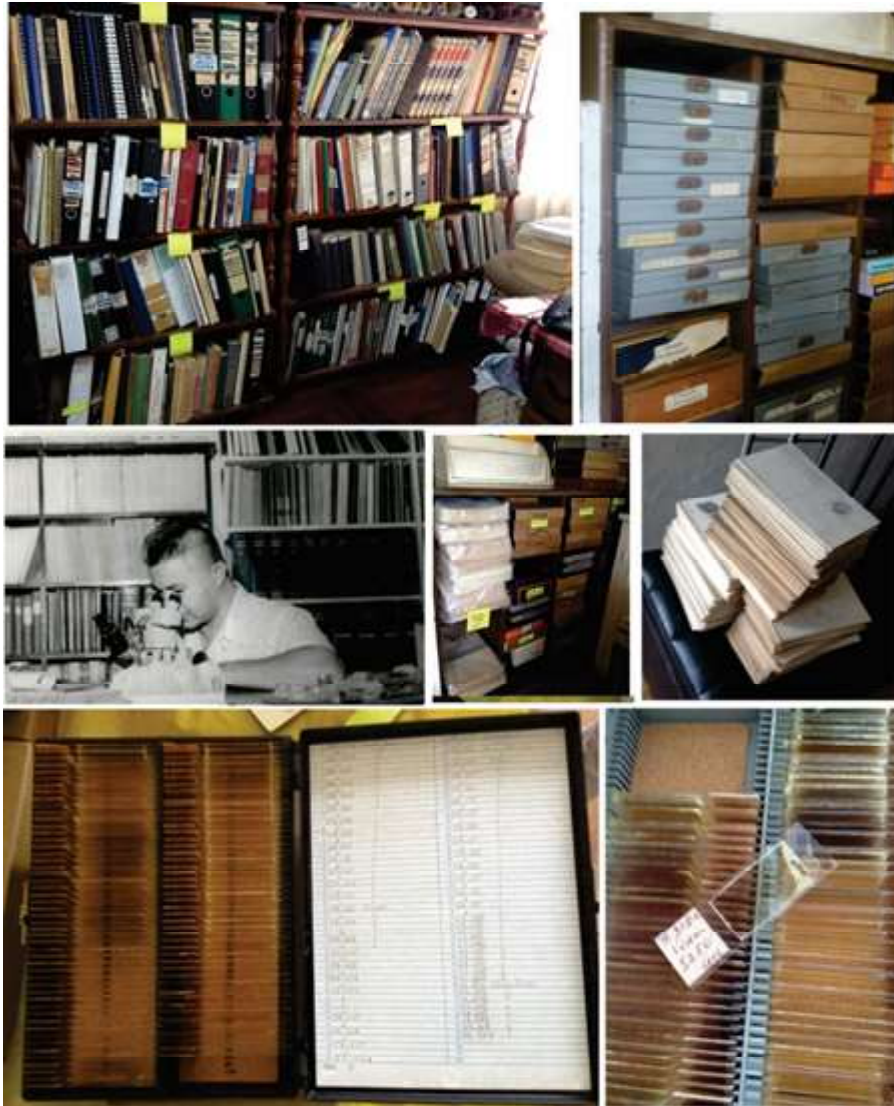
Figura 2 Recuperación del material bibliográfico y preparados palinológicos de colección «Elías Aliaga», incorporado al INGEMMET

cuenas, dentro de la misma a nivel de reservorio petrolero (Simmonds et al., 2000).