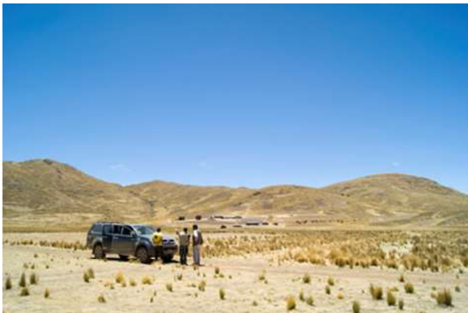
Figura 1 Afloramiento del Cerro Yana Apacheta