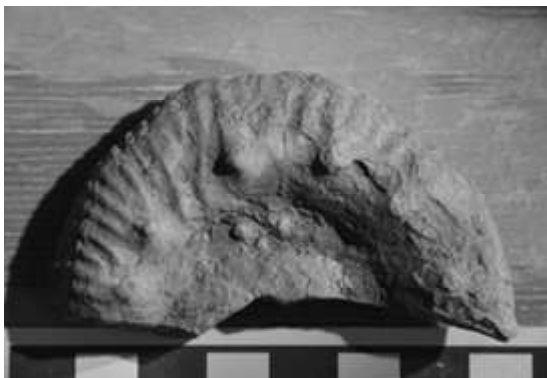
Figura 3 Himalayites treubi DOUVILLÉ (1912)

El ejemplar H. treubi sujiere una correlación regional con la Formación Labra en Arequipa y con la Formación Chachacumane en Tacna. La correlación de Puno con estas dos localidades, aclara la división con la Formación Cachios. Aunque están consideradas en la figura como pertenecientes al grupo Yura, queda evidente que es una asignación en desuso y hay que señalar que la división bioestratigráfica con la edad Titoniana, marca diferencia y que los estratos fosilíferos dejen de ser grupo Yura, si es que la transición estratigráfica/petrológica así lo permiten desde un punto de vista ambiental sedimentario; pero si la litología da indicios de transición sedimentaria gradual o de continuidad entonces podrían ser indicios de que la división (zonación estándar) con el Tithoniano pudiera