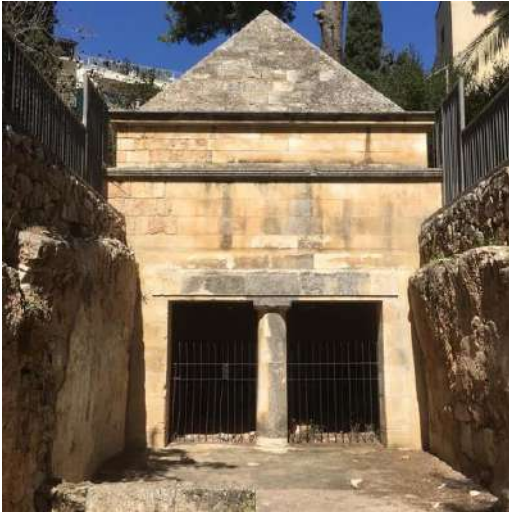
Fig. 2. Gerusalemme, facciata della tomba di Giasone (foto Autore, 2019).

provrebbero le lucerne erodiane al di sotto dello strato di crollo della parte anteriore della costruzione, già in abbandono da alcuni anni 13 .