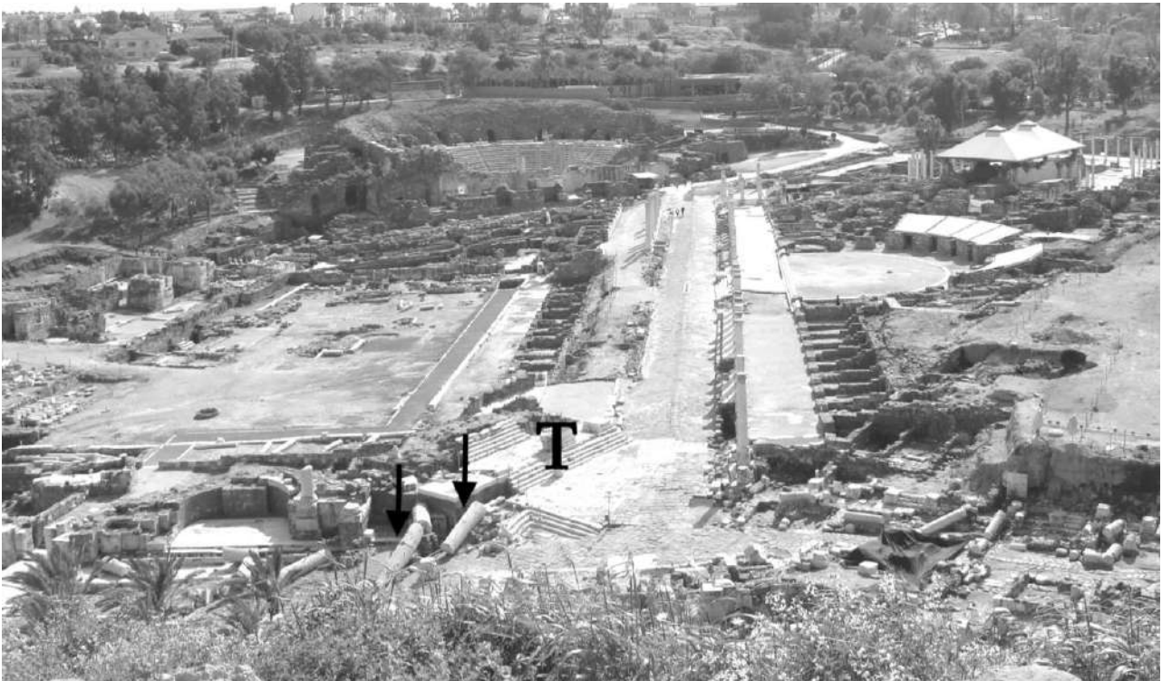
Fig. 6. Beit She'an, vista dall'acropoli a nord della via di Dioniso. La T indica il tempio eretto all'incrocio tra cardo e decumano; le frecce indicano la trabeazione e le colonne rimaste in piedi e poi crollate sulla strada nell'VIII sec. d.C..

della colonna (Fig. 7) non vi sia alcun incavo per perno per ancorare il capitello soprastante, sebbene il piano di attesa di quest'ultimo abbia un foro centrale (Fig. 8) 56 ; una delle due colonne lisce a terra presenta