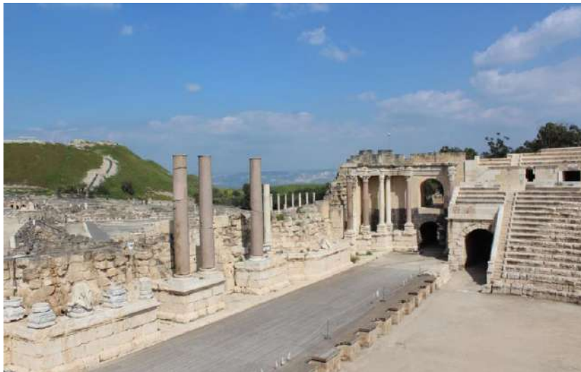
Fig. 5. Beit She'an, vista della scaenae frons del teatro dopo l'anastilosi.

trabeazione e capitelli in marmo e una porticus in summa cavea 50 . Il terremoto del 363 causò ingenti danni all'edificio che tuttavia fu solo parzialmente ripristinato: la fronte della scena fu ridotta in altezza a soli due ordini e molte colonne sostituite con quelle in calcare recuperate dalla porticus in summa cavea , che non venne riedificata 51 (Fig. 5).