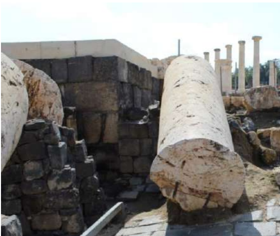
Fig. 7. Beit She'an, colonna del tempio crollata sulla strada nell'VIII secolo d.C. in cui si vede il piano di attesa (foto Autore, 2014).