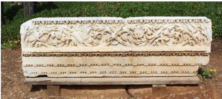
Fig. 4. Cesarea Marittima, blocco di architrave dalla scaenae frons del teatro relativo al rifacimento di età severiana (foto Autore, 2019).

Si può ipotizzare che il rinnovamento del teatro di Cesarea nel II sec. d.C. possa essersi reso necessario come conseguenza dell'evento sismico prima ricordato, oltre che per un generale degrado della struttura per una molteplicità di cause. L'edificio teatrale, costruito da Erode negli anni Venti del I sec. a.C. in prossimità della costa, manca a tutt'oggi di uno studio complessivo a distanza di sessant'anni dallo scavo. Antonio Frova, che tra il 1959 e il 1965 mise in luce l'edificio, annotava che "...nel giro superiore della cavea si è notato all'estremità meridionale uno sfaldamento e uno smottamento che determinarono la distruzione di tutta quella parte malgrado l'evidente tamponamento e i tentativi di consolidamento; l'anulare si apriva e finì per spezzarsi" 28 . Il cedimento strutturale del settore meridionale della cavea potrebbe avere avuto origine proprio da un evento sismico. I materiali relativi alla scaenae frons – seppur