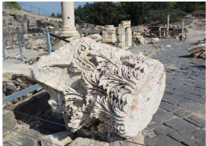
Fig. 8. Beit She'an, capitello (corrispondente alla colonna in foto 7) su cui si vede il foro per perno centrale sul piano di posa.