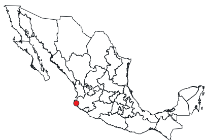
Figura 1. Ubicación de la Cuenca del río Cuitzmala. Figure 1. Location of the Cuitzmala River Basin.