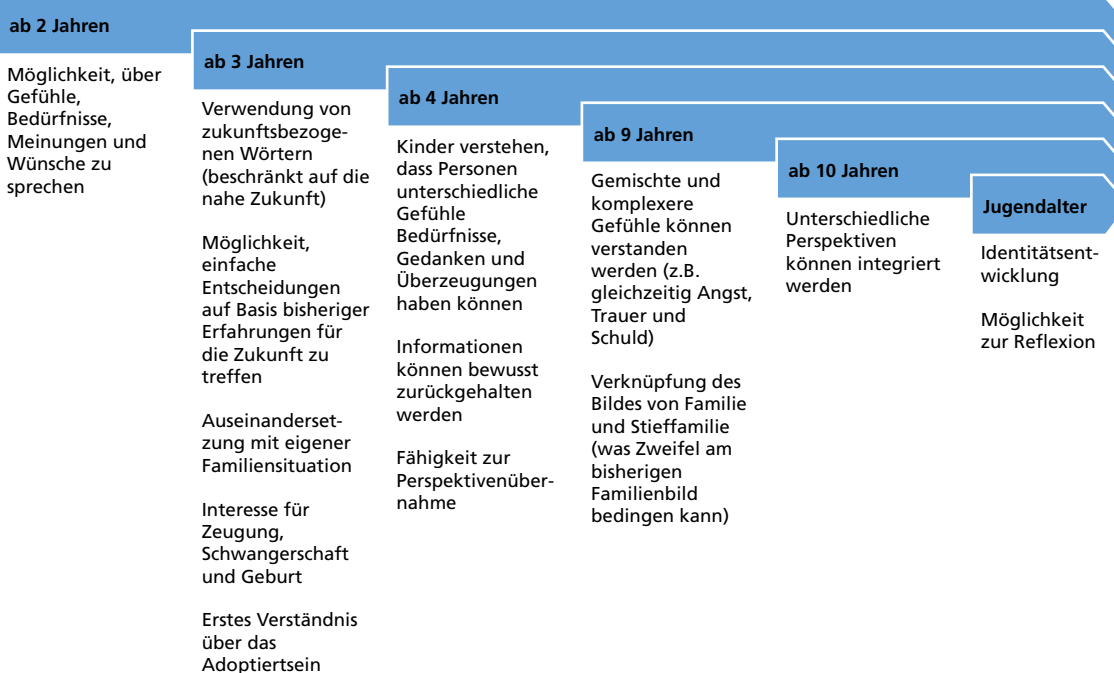
Abbildung 1: Entwicklungsschritte nach Altersstufen 7

Um einen Willen bilden und äußern zu können, brauchen Kinder bestimmte kognitive und/oder sprachliche Fertigkeiten sowie die Fähigkeit, eigene Ziele sowohl entwickeln („Wenn ich groß bin, möchte ich XY werden.“) als auch verfolgen zu können. Das ist besonders wichtig, da es vor allem jüngeren Kindern häufig noch schwerfällt, ihre eigene Meinung und/oder Wünsche von denen der Eltern abzugrenzen. 6