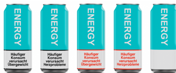
Abbildung 1. Stimulusmaterial: Fiktive Energydrink-Getränkedosen mit verschiedenen gestalteten Warnhinweisen (Kontrollgruppe).

Das Stimulusmaterial bestand aus der Abbildung einer Dose eines fiktiven Energydrinks. Die oberen 70 Prozent der Dose sind in allen Manipulationen identisch. Dieser Bereich zeigt einen um 90 Grad gedrehten Schriftzug mit der Aufschrift Energy in weißer Schrift auf türkisfarbenen Grund. Unterhalb dieses Bereiches befindet sich der Warnhinweis, der für die vier Experimentalgruppen variiert wurde. Die Größe des Warnhinweises beträgt 30 Prozent der sichtbaren Fläche, die Schriftart ist Helvetica (siehe Abbildung 1). Diese Gestaltung der Warnhinweise orientierte sich an Vorgaben der Europäischen Union für Zigarettenverpackungen. Ein Manipulationscheck mit N = 28 Teilnehmenden ( M = 26.57 Jahre; SD = 7.02 ; 50 Prozent weiblich) bestätigte die Effektivität der Manipulation (prozentuale korrekte Zuordnung: Art des thematisierten Risikos = 100 Prozent; farbliche Gestaltung = 100 Prozent).