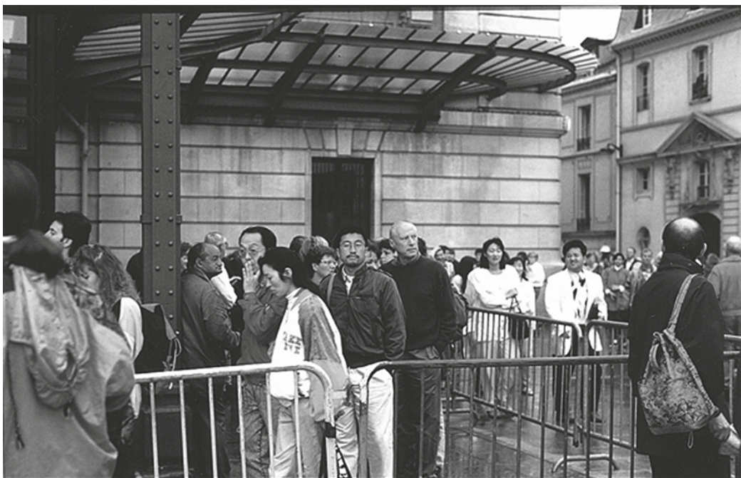
Abbildung 1: Datum 2

Was sehen wir auf dem Foto (vgl. Abb. 1)? Leute stehen Schlange vor dem Musée d’Orsay in Paris. Im Seminar können viele nichts mit diesem Bild anfangen. Auf den Bildern davor waren wenigstens noch schöne muskulöse Männer zu sehen. Es gab eine nachvollziehbare Ordnung. Die schönen Männer führten etwas auf wie einen Tanz; Passanten, Leute im Café, fotografierende Touristen sahen ihnen zu. So entstand eindeutige Gerichtetheit von Zentrum und Peripherie. Hier sehen wir eine Absperrung, dahinter Leute, die nach links gehen oder nach links ausgerichtet stehen. Dahinter eine Gebäudefassade mit Überdachung aus Stahlträgern und Glas und weiter rechts weitere Gebäudefassaden der angrenzenden Straße, auch dort viele Menschen. Die Leute in der Schlange