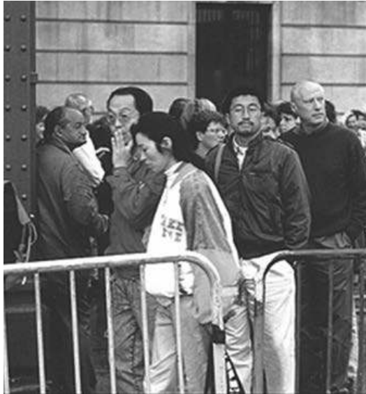
Abbildung 3: Datum 2b

Dort steht ein Mann, mit dem Rücken angelehnt an den Stahlträger mit den aufgesetzten Schraubköpfen. Körper und Blick sind in die andere Richtung, nach rechts, gewendet. Wie er schaut und wie er da steht, die Bewegung der Warteschlange ignorierend, gegen den Strom; schließlich wie er gekleidet ist, mit Parka oder verknittertem Jackett... – „Er tanzt irgendwie aus der Reihe“, bemerkt jemand im Seminar dazu. Das Gesicht des Mannes hat einen ganz anderen Ausdruck. Es spiegelt kaum touristisches Interesse, eher Müdigkeit, Verdrossenheit. Wohl kaum ein älterer Tourist, müde des Wartens, der die Wartenden vorüberziehen lässt, um zu verschnauften, wird angemerkt. Tatsächlich ist er ein sogenannter Clochard, inmitten der Warteschlange. Er hält den Vorbeigehenden einen Becher hin. Das sieht man aber nicht genau. Die rechte Hand ist verdeckt. Aber die Fotografin bestätigt das. Spricht er die wartenden Leute gar an?