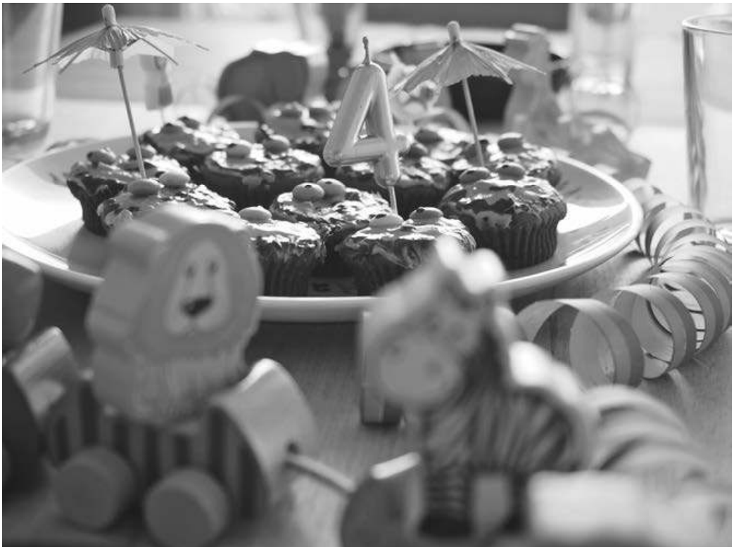
Abbildung 1: Dekorierter Tisch für den Kindergeburtstag eines Vierjährigen

Diese Entwicklung von einer naturwüchsigen und nebensächlich begleiteten Kindheit hin zu einer „Inszenierung von Kindheit“ (Beck-Gernsheim 1990, S. 172; vgl. auch Pofertl 2008) wird dann auch im Kindesalter fortgeführt. Seit die evangelische Kirche in Deutschland das Jahr 2011 zum „Jahr der Taufe“ ausrief und die Gemeinden zu neuen Formen der Tauffeiern aufrief, ist eine Eventisierung evangelischer Taufen – beispielsweise mit Großtaufen und Flusstaufen – zu verzeichnen (vgl. Beetschen 2019; Ullmann 2017). Zu den eine Aufladung erfahrenden religiösen Ereignissen in der Kindheit zählen ebenso Kommunion- und Konfirmationsfeiern. Ein weitaus bedeutenderes Feld für die Eventisierung der Kindheit ist allerdings der Kindergeburtstag (vgl. Abb. 1). Das Angebot externer Dienstleister nimmt rapide zu: von Zauberern über Bastelbusse bis hin zu buchbaren Räumen in Freizeitorten wie Kletterhallen und Spaßbädern inklusive Animation und aufwändiger Dekoration (vgl. Niebuhr 2018). Schließlich gibt es Eventisierungstendenzen rund um Statuspassagen im Bildungsbereich. Der erste Schultag wird dabei ebenso mit Einschulungsbuffets, außeralltäglichen Programmpunkten, Feierlichkeiten, langen Gästelisten und Geschenkewunschzetteln (vgl. Knipper 2018) aufgewertet wie die Abiturfeier.