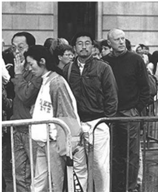
Abbildung 2: Datum 2a

Das ist sehr unpräzise. Wohin gehen diese Blicke? Sie schauen nicht auf den gleichen Punkt. Und das vordere, asiatisch aussehende Paar scheint mit sich selbst beschäftigt. Er, die linke Handfläche an Kinn und Mund, sie eher gesenkten Blicks in Zuhörerhaltung. Gleich darauf folgt ein anderer Mann, mit Brille und Bart. Wo schaut er hin? Dahinter steht ein großer Mann mit hoher Stirn und nur noch wenig Haaren. Blickt er verträumt in die Ferne, wie eine Betrachterin es formuliert? Beide haben eine Hand – soweit man sieht – in der Tasche vergraben. Auch hinter dem asiatischen Paar, halb verdeckt, sieht man eine Frau, die ihren Blick irgendwohin wendet. Keine der drei identifizierbaren Personen schaut in dieselbe Richtung.