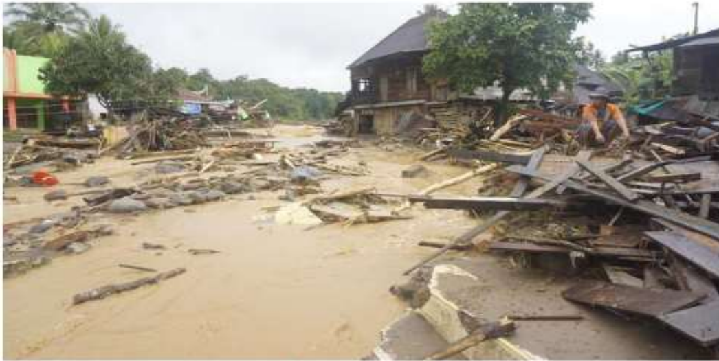
مصدر الخبر: detikNews