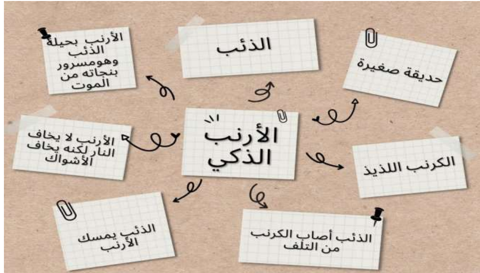
صورة رقم: (٢) نموذج كتابة الطالب