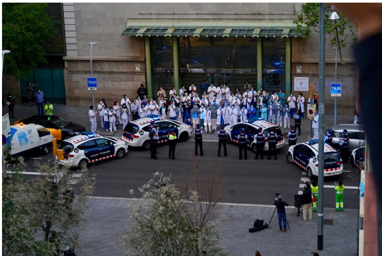
Música i aplaudiments a les 20 h des de les finestres, terrasses i balcons a la ciutat de Barcelona per suportar el confinament i rendir homenatge als sanitaris que estaven en primera línia lluitant contra la pandèmia (Hospital Clínic, Barcelona, abril, 2020). PACO PERIS

Partint del principi que tot subjecte és una realitat vivent, direm que exigeix una reflexió capaç d'articular elements complexos, com incloure incerteses de les dades ofertes en un estudi científic. Les ciències ensenyen moltes certeses, però no els innombrables camps d'incerteses. Això exigeix un treball de comprensió i diàleg que va més enllà de les frustracions amb les pròpies expectatives o limitacions metodològiques o disciplinàries.