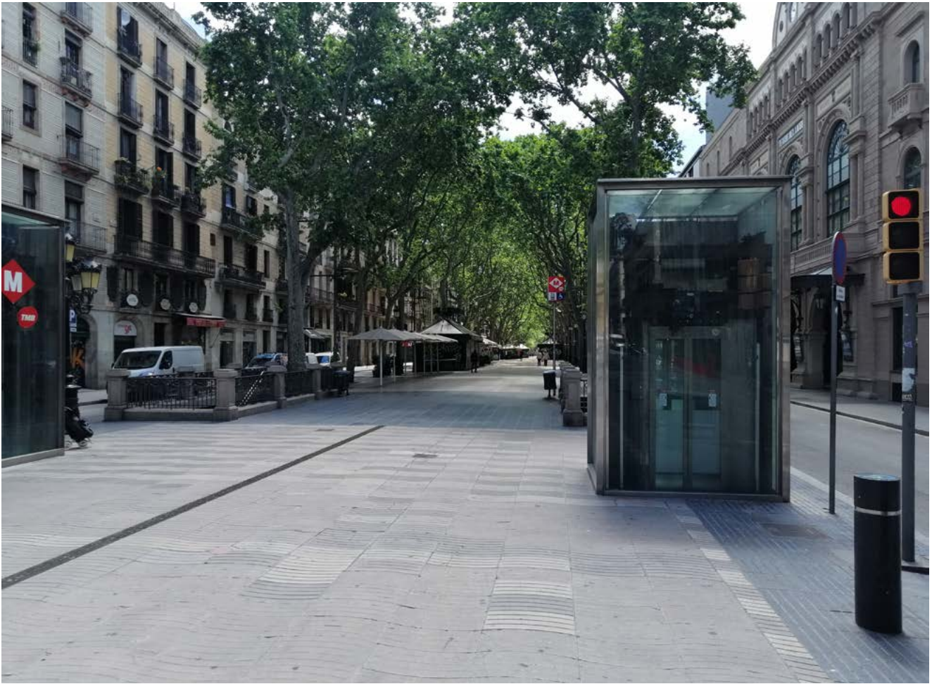
Durant el confinament, la ciutat va quedar buida, mentre tothom estava reclòs a casa. El fet semiològic està principalment en el detall del semàfor vermell (Les Rambles, Barcelona, 7 d'abril del 2020 a les 12 h del migdia durant la Setmana Santa).

En el període comprès entre l'abril i el juliol de 2020, un grup d'investigadors interdisciplinaris va explorar les diferents interpretacions que feien els subjectes sobre les condicions de confinament i pandèmia de la Covid-19 a diferents països, centrant-se en l'àmbit de la salut mental. Van examinar cinc dimensions de percepció de la realitat (social, econòmica, psicoafectiva, sensorial i política) dels microsistemes socials, com les famílies i les relacions interpersonals. La manera en què els participants deien percebre la seva situació davant d'un fenomen mundial de contagi dona compte de com s'enfronten les modificacions imposades en els àmbits de representació de la vida, la mort i el perill d'una malaltia desconeguda. En el present article es discuteixen alguns dels resultats obtinguts a Catalunya, prenent en consideració només la dimensió sensorial.