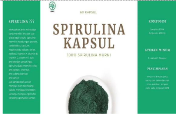
Figure 4. Desain Label pada Botol Kapsul Spirulina