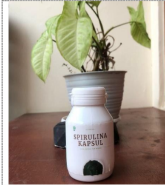
Figure 3. Produk Kapsul Spirulina siap dipasarkan