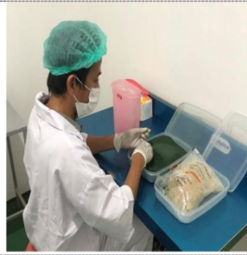
Figure 2. Proses Memasukkan Spirulina ke dalam Kapsul.