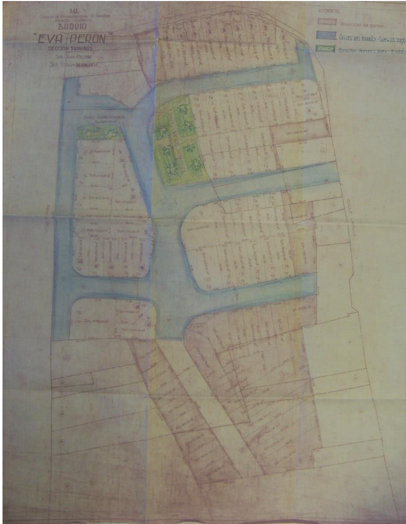
Figura. 6. Plano del barrio Eva Perón de Trinidad. Misceláneas de Gobierno 1 Documento N° 24. 1953 Archivo General de la Provincia de San Juan

Luego del golpe de 1955, vecinos de lo que luego fue Villa América presentaron varias solicitudes al Interventor Pica, relativas a mejoras generales del entorno, la cesión de terrenos de al lado de la escuela que estaban en posesión de la CGT en los que se pretendía construir un balneario, cancha de volley y básquet, entre otros. El petitorio incluía en cambio de nombre de la Villa que se llamaba luego de la proscripción General Jufre. (Misceláneas de gobierno 1 Caja n° 58, documento n°19) lo que sucedió el 6 de diciembre de 1955, de acuerdo a lo concedido por el Ministro de Obras Públicas.