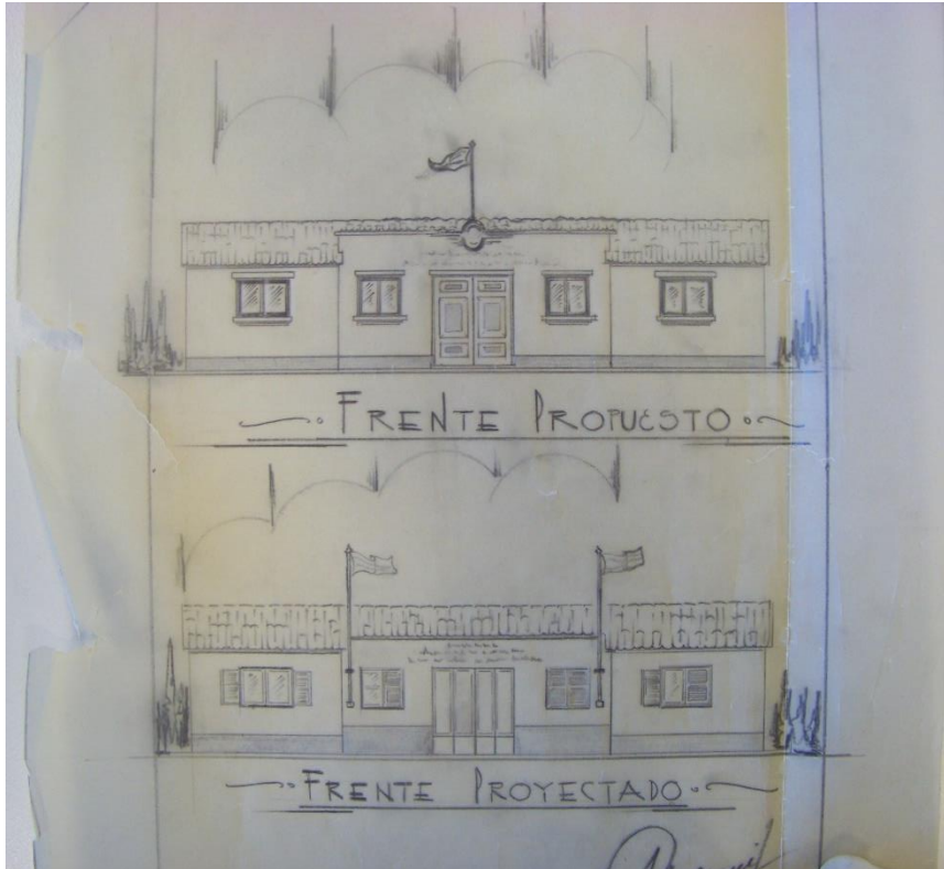
Figura. 5. Propuestas para "Proveedurías populares Eva Perón. Misceláneas de Gobierno 1, Caja n° 58, documento n° 14. Archivo General de la Provincia de San Juan.

La tipología de ciudad-jardín había sido expresamente impulsada por Eva Perón en términos tanto éticos como formales ya que permitía a los sectores populares gozar de espacios saludables y estéticos. (Larrañaga y Petrina, 1987: 211) Los barrios eran diseñados como células urbanas que funcionaban autónomamente, cuyas teorías se habían comenzado a discutir en los años 1920 y se implementaron en la enorme cantidad de barrios suburbanos que se construyeron en esta etapa a lo largo y a lo ancho del país.