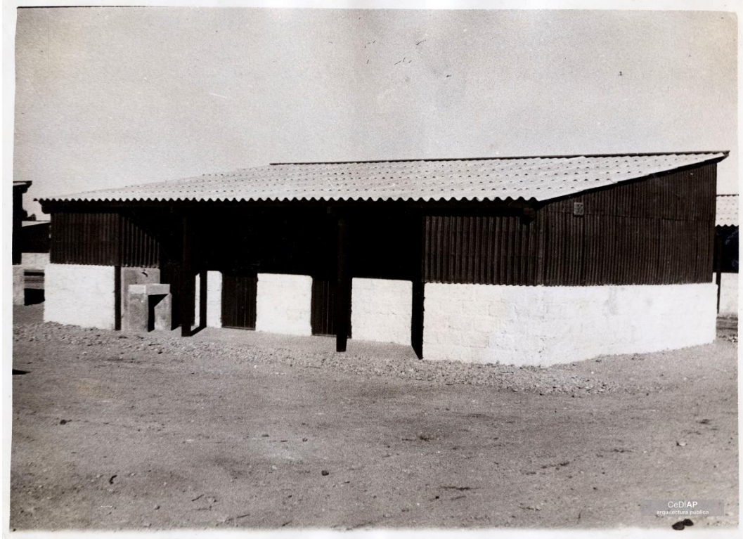
Figura 2. Vistas de viviendas de emergencia. Casa de dos habitaciones con baño y cocina. Fuente MOP. Disponible en el CEDIAP http://cdi.mecon.gob.ar/cediap/

Esta clasificación se contradice levemente con lo que ha quedado registrado en el informe de la Contraloría, que indica que muchas viviendas de los barrios más grandes como el Capitán Lazo y el 4 de junio, contaban con más de tres habitaciones 2 . En relación a los servicios, observamos también algunas diferencias dentro de un mismo conjunto, un ejemplo es el Barrio Bardiani, según algunos de sus habitantes estaba dividido en dos secciones: la sección Crespo que comenzaba en la calle General Acha y terminaba en la plaza, estaba conformada por casas que tenían agua corriente y baño; por el contrario en la sección Trullol las viviendas que no contaban con baño ni agua corriente por lo que habían servicios sanitarios comunitarios y existían surtidores o canillas de agua corriente.