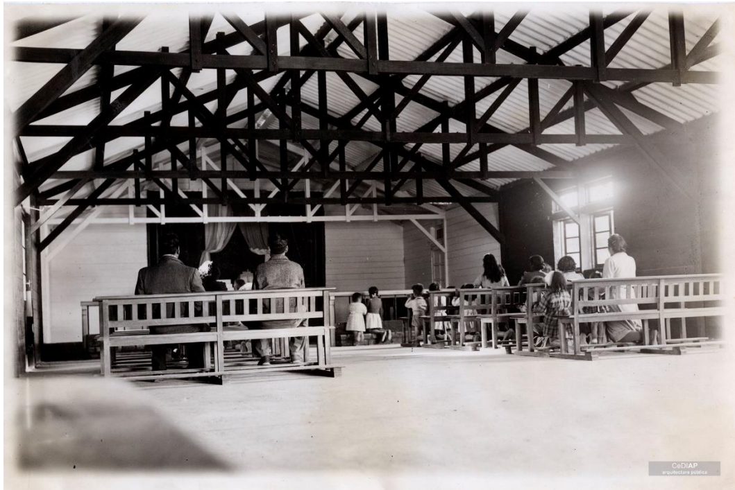
Figura 3. Vista interior de la capilla Santa Teresita. Barrio Capitán Eduardo Lazo. Fuente MOP. Disponible en el CEDIAP http://cdi.mecon.gob.ar/cediap/

Según este mismo organismo el MOP consignaba 3 modelos de casillas: