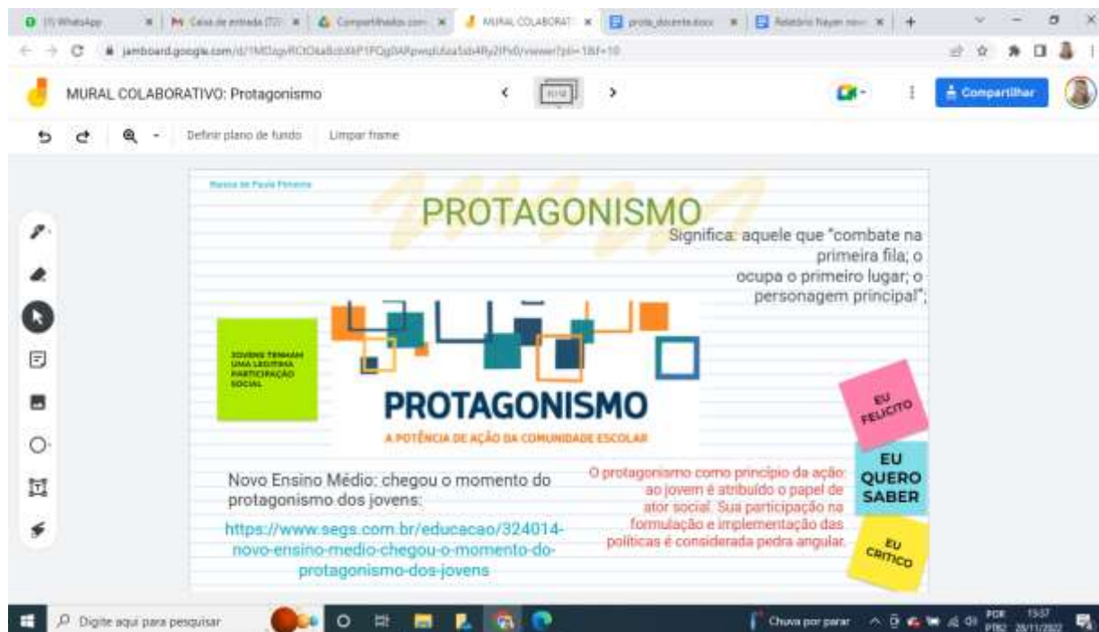
Figura 5. Mural colaborativo acerca de Gestão Educacional

SILVA, M. I; OLIVEIRA, B. C. R. O; RIBEIRO, R. A. S; DIAS, C. M. C.