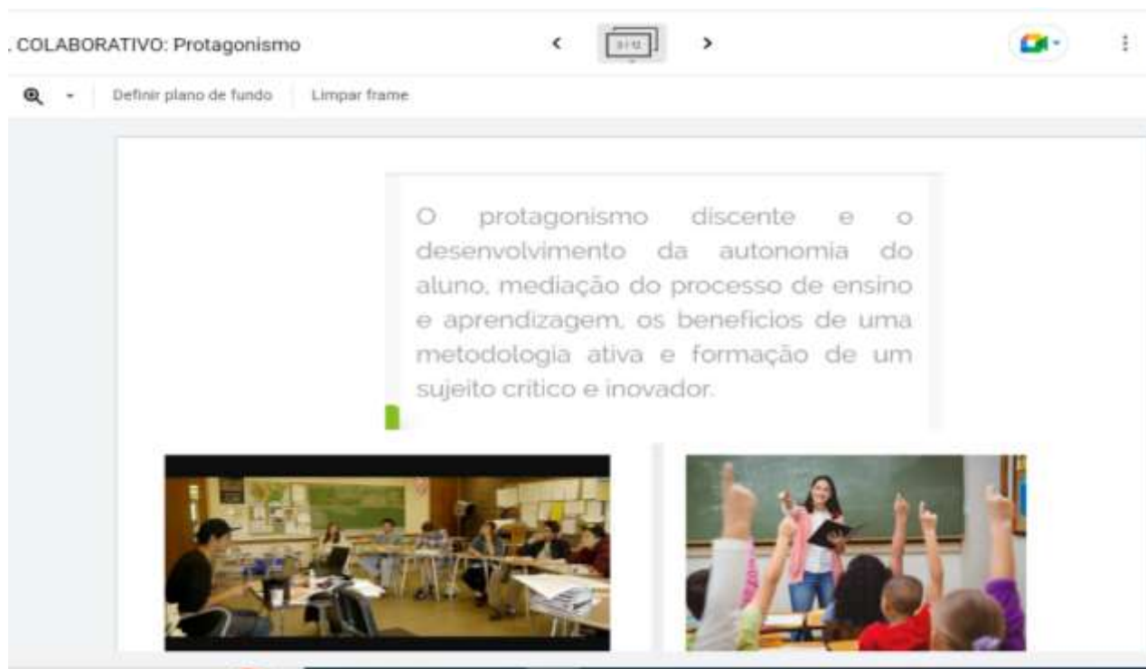
Figura 4. Formação continuada- Educação Integral na prática: planejamento, currículo e projeto político pedagógico.

SILVA, M. I; OLIVEIRA, B. C. R. O; RIBEIRO, R. A. S; DIAS, C. M. C.