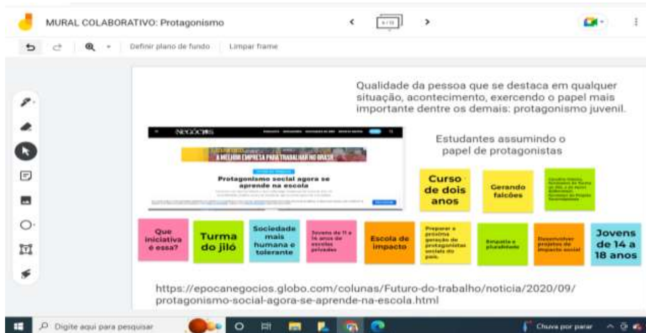
Figura 3. Protagonismo docente e discente