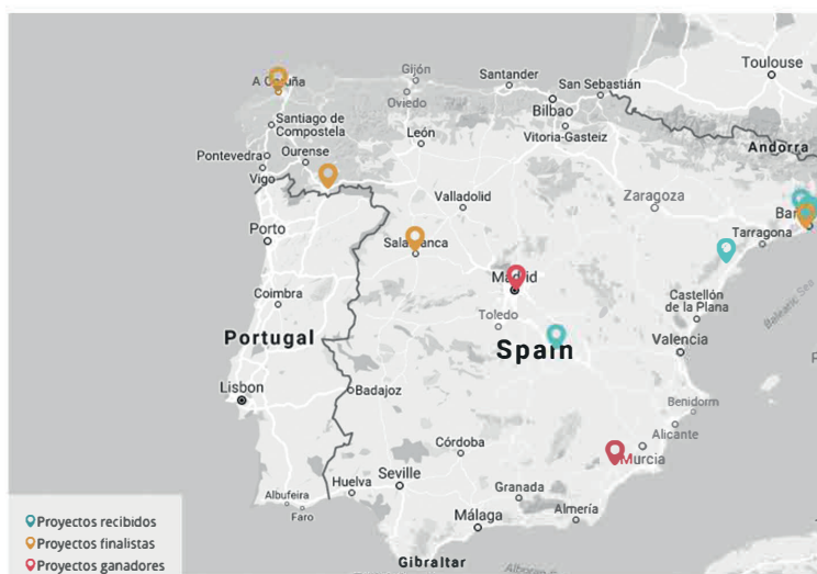
Mapa de proyectos de bibliotecas públicas para la inclusión social. 2016.