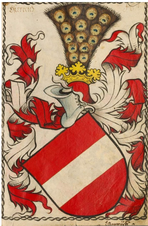
Slika 1: Grb babenberške rodbine. 20

svojega karakterja in neprestanih sporov s svojimi sosedi umrl brez sinov in brez točno določenega naslednika za vojvodino Avstrijo ter Štajersko. 19