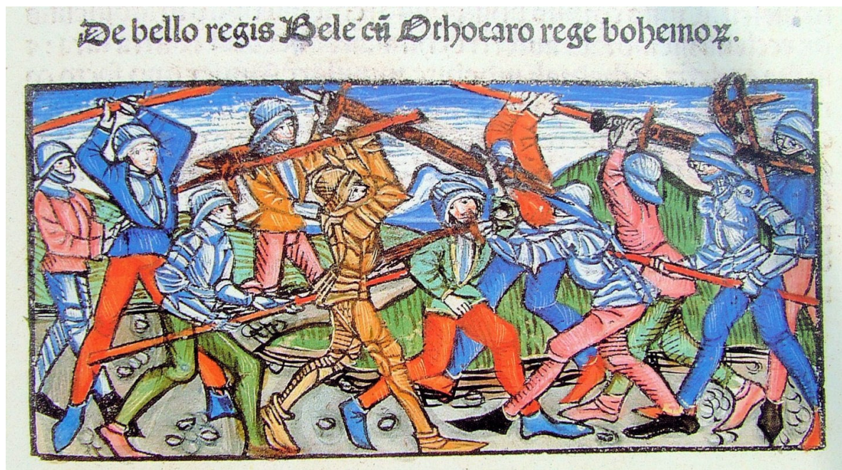
Slika 3: Ilustracija boja med ogrskim kraljem Belo IV. in češkim kraljem Otokarjem II. leta 1260 v bitki pri Kressenbrunnu. 99

Bitka pri Kressenbrunnu se je začela z napadom kumanskih lokostrelcev. Gre za pripadnike turškega nomadskega plemena, ki so se bojevali na strani ogrske vojske. Njihov napad je bil sprva zelo uspešen in je pokončal veliko število Otokarjevih vitezov. Na tej točki je bilo videti, da bo ogrski prestolonaslednik Štefan V. premagal svojega nasprotnika. Do preobrata v bitki pa je prišlo, ko je okoli 7.000 avstrijskih, čeških in štajerskih težkih konjenikov izvedlo velik protinapad. Ogrska vojska ni zdržala pritiska konjeniškega napada in se je pognala v beg. Otokar je Štefana in njegove bojovnike zasledoval vse do Bratislave, vendar mu njega in preostanka ogrske vojske ni uspelo ujeti. Sama bitka pri Kressenbrunnu je bila velika zmaga za češkega kralja, v kateri naj bi se tudi sam skupaj s škofom Brunom iz Olomuca in zaveznikoma Filipom ter Ulrikom Spanheimskim izkazal s svojim pogumom. Žrtev je bilo veliko na obeh straneh, nedvomno pa je več izgub imela ogrska stran, ki je izgubila okoli 18.000 bojnikov na samem bojnem polju in dodatnih 14.000 bojnikov, ki so se med begom utopili v reki Moravi. 100