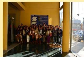
IES José Cadalso

Más de 150 alumnos han podido visitar las instalaciones del CNA durante la Semana de la Ciencia.