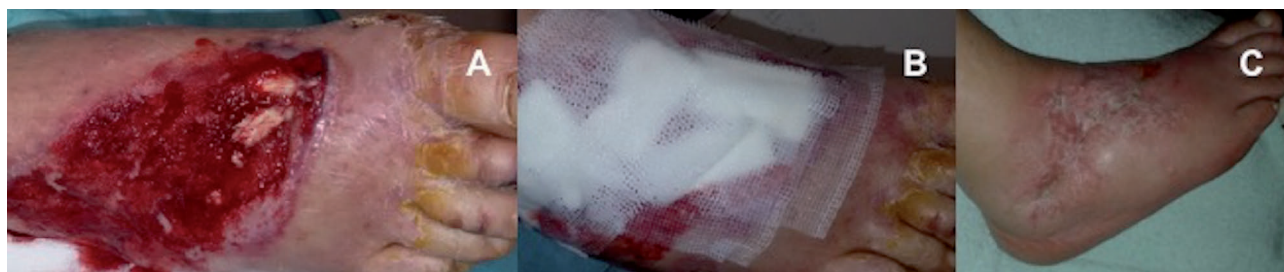
Figura 1. Ferita posttraumatica del piede destro con esposizione tendinea dopo sbrigliamento chirurgico e terapia a pressione negativa (A); Applicazione di Bionect Pad sul letto della ferita (B), visita di follow-up a 45 giorni (C).