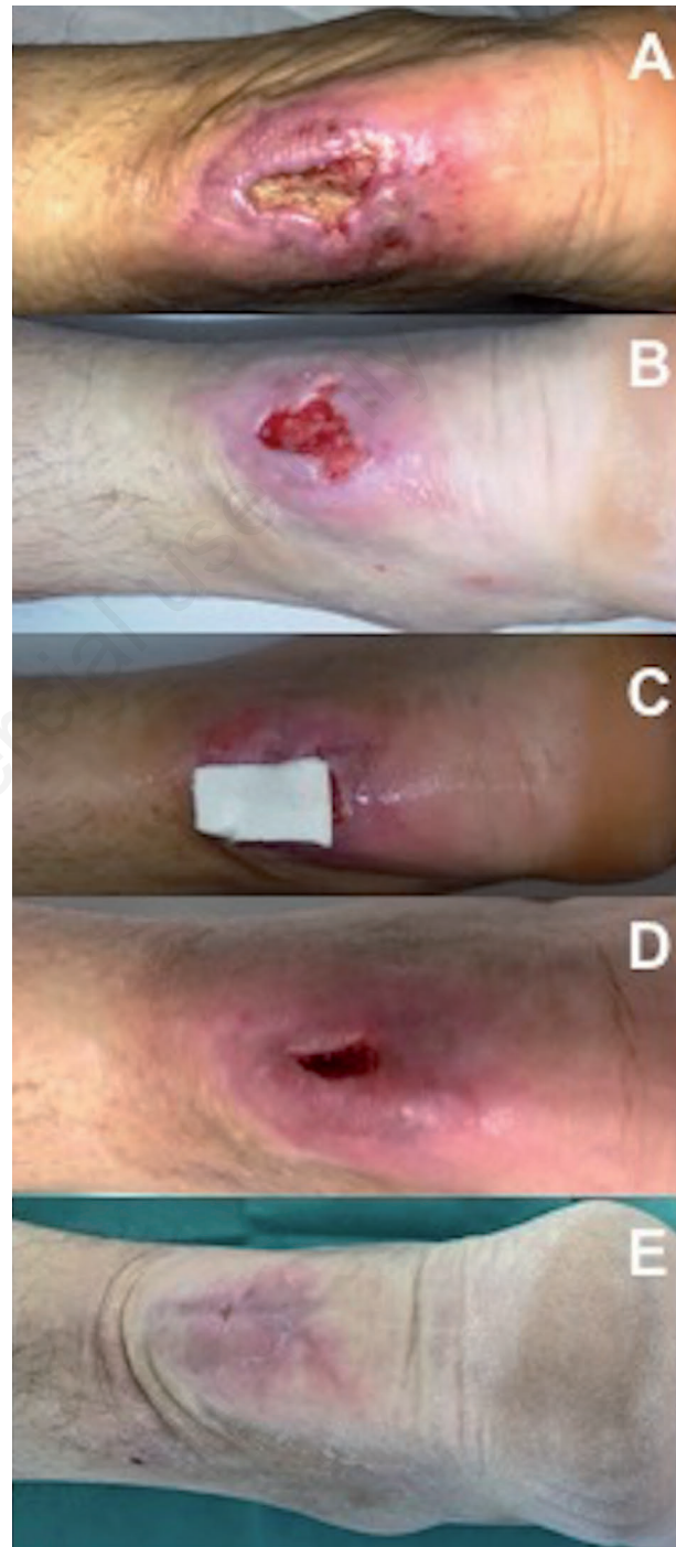
Figura 2. Deiscenza della ferita con esposizione del tendine di Achille (A); dopo un'adeguata preparazione del letto della ferita è stata applicata una matrice di Bionect Pad (B-C). Visita di follow-up dopo 50 giorni (D); la guarigione completa della ferita è stata ottenuta dopo 76 giorni (E).

di altri materiali (ad esempio i derivati del chitosano). Tuttavia, la resistenza in vivo degli impianti a base di AI e dell'AI iniettato, dipende dalla loro capacità di resistere