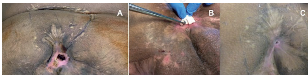
Figura 3. Recidiva di una lesione da pressione sacrale in un paziente paraplegico (A); completa guarigione della ferita dopo 6 settimane di trattamento con Bionect Pad (B-C).

intatto nativo e dei frammenti di collagene parzialmente degradati. L'elevato rapporto tra MMP e inibitori tissutali di MMP porta a un'eccessiva degradazione della matrice extracellulare. L'elastasi è anche coinvolta nel processo di guarigione grazie al suo ruolo nel convertire i pro-MMP (il precursore naturale degli MMP) in MMP attivi. L'attività dell'elastasi è elevata nella ferita cronica, contribuendo così fortemente al carico di MMP nella ferita stessa. In sintesi, la ferita cronica è caratterizzata sia da una diminuzione della deposizione di collagene che da un aumento della degradazione del collagene. 6 Pertanto l'uso di medicazioni al collagene nella gestione della ferita può sembrare attraente grazie all'inibizione o disattivazione delle MMP, all'aumentata produzione e permeazione dei fibroblasti, all'aiuto nell'assorbimento e biodisponibilità della fibronectina, per la conservazione di leucociti, macrofagi, fibroblasti e cellule epiteliali e supporto nel mantenimento del microambiente chimico e termostatico della ferita. 5 Le medicazioni al collagene caratterizzate da un pH basso, possono abbassare il pH del liquido della ferita,