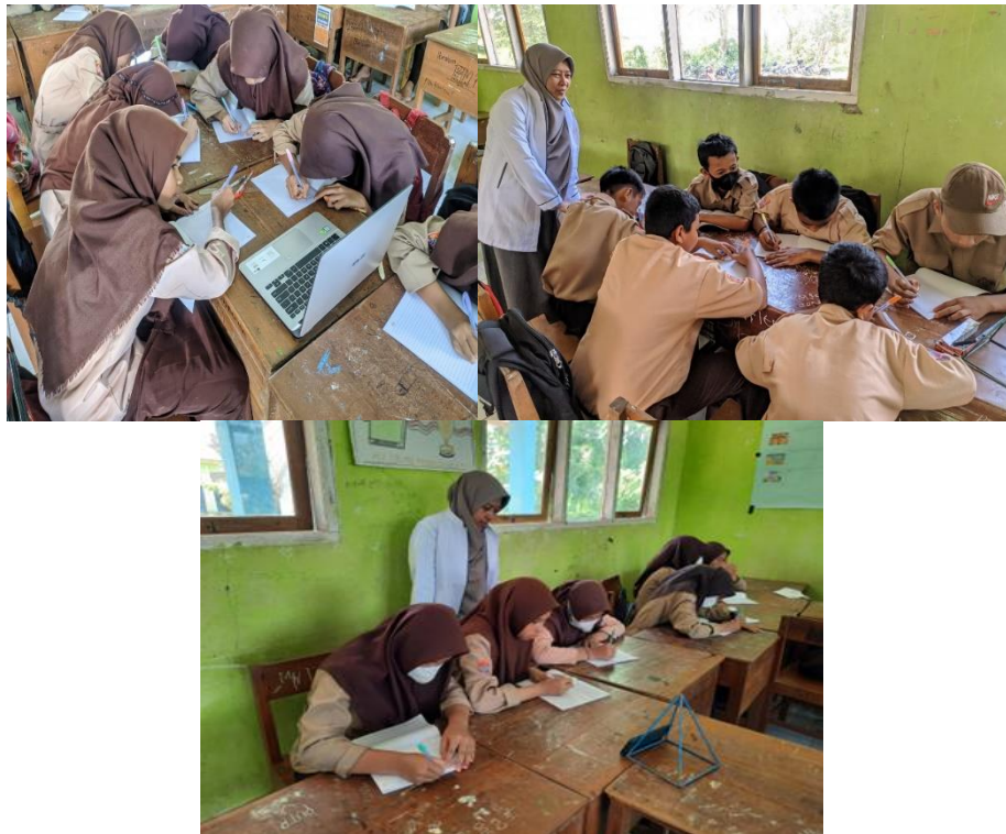
Gambar 3. Siswa Menulis Teks Ulasan dengan Menyimak Video pada Chanel Youtube 'Kok Bisa?'