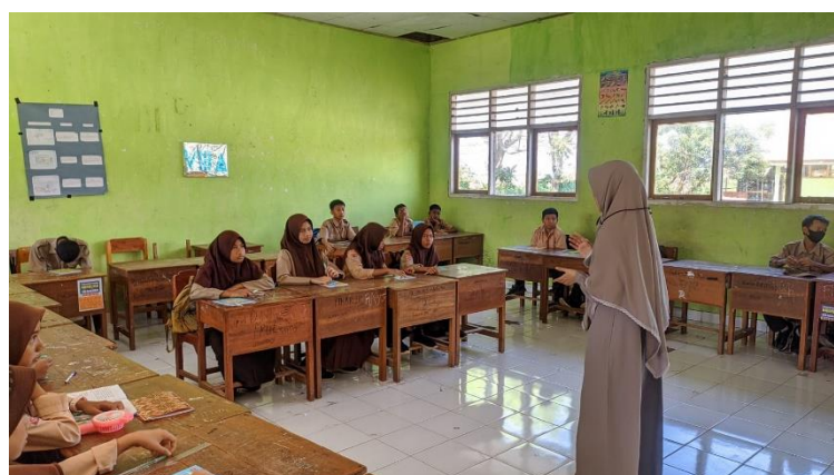
Gambar 2. Pemberian Materi Menulis Teks Ulasan

Kegiatan PKM ini dilakukan dengan dua kali pertemuan. Waktu yang digunakan dalam setiap pertemuan yaitu 45 menit sesuai dengan jadwal mata pelajaran di sekolah. Mitra yang terlibat dalam kegiatan PKM ini adalah siswa kelas VIII yang berjumlah 30 orang siswa. Pada pertemuan pertama tim PKM melakukan pertemuan dengan kepala sekolah SMP Negeri 1 Sanrobone tentang kesiapan dalam kegiatan pelatihan menulis teks ulasan menggunakan media youtube. Pada pertemuan kedua tim PKM masuk ke dalam kelas untuk memberikan pelatihan menulis teks ulasan menggunakan media youtube, sebelum memberikan pelatihan, tim PKM memberikan materi mengenai menulis teks ulasan. Setelah memberikan materi, tim PKM membentuk pembelajaran berkelompok untuk siswa dengan tiga kelompok.