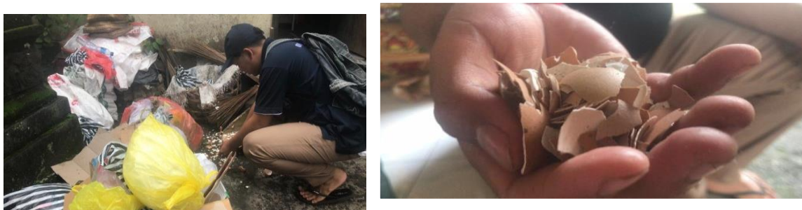
Gambar 3. Pencarian Limbah Pangan Cangkang Telur

Kegiatan Praktik pengerjaan diawali dengan mengumpulkan limbah pangan yaitu cangkang telur di sekitaran Banjar Karanganyar Sanding. Cangkang telur yang baik untuk digunakan adalah cangkang telur ayam kampung (Melsa et al., 2016).