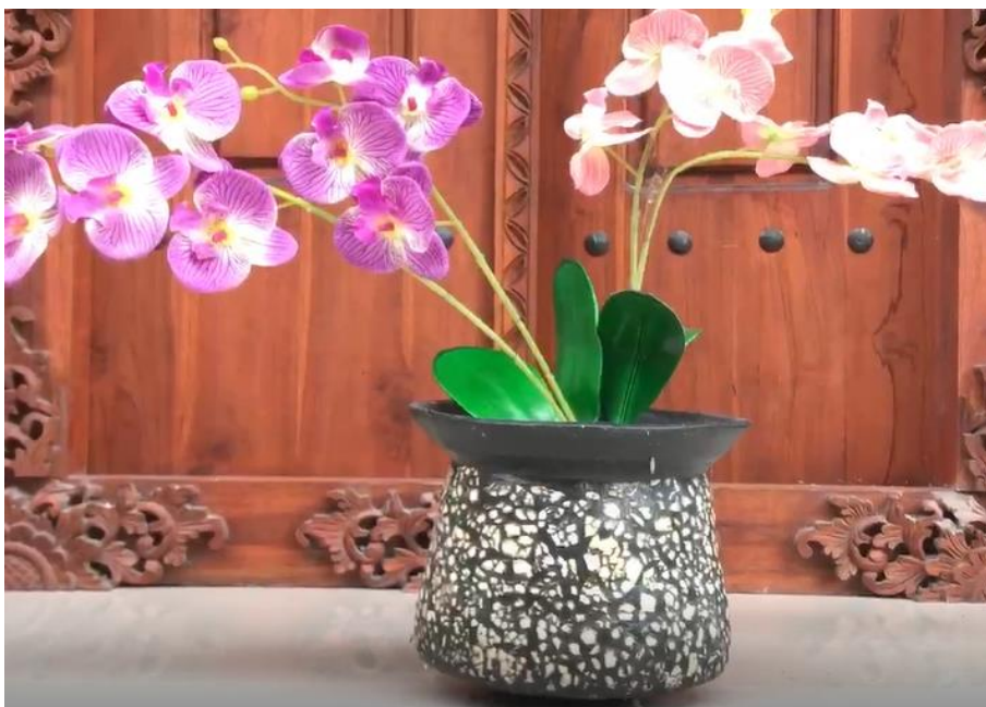
Gambar 7. Hasil Modifikasi Gerabah Menggunakan Cangkang Telur