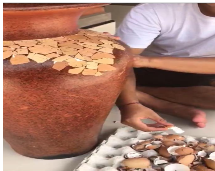
Gambar 4. Tahapan Penempelan Cangkang Telur

Setelah limbah cangkang telur terkumpul, proses modifikasi gerabah sesuai dengan program kerja dapat dilanjutkan. Proses ini melewati tiga tahapan yaitu, tahapan penempelan, tahapan pengecatan dan tahapan penghalusan.