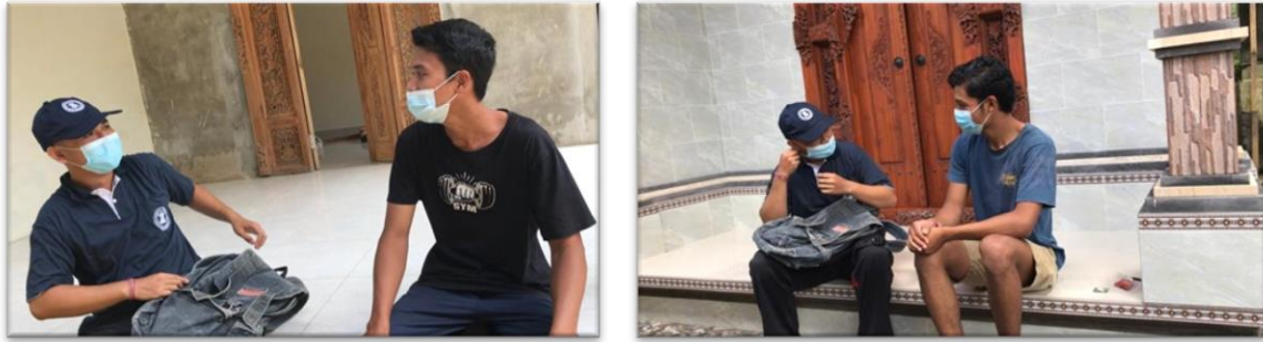
Gambar 2. Pelaksanaan Penyuluhan oleh Tim Pelaksana Pengabdian