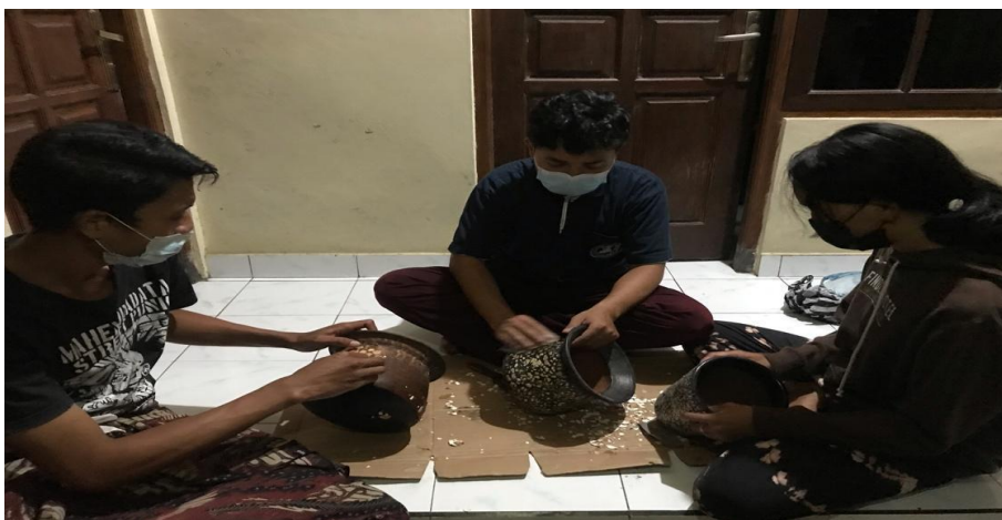
Gambar 6. Tahapan Proses Penghalusan