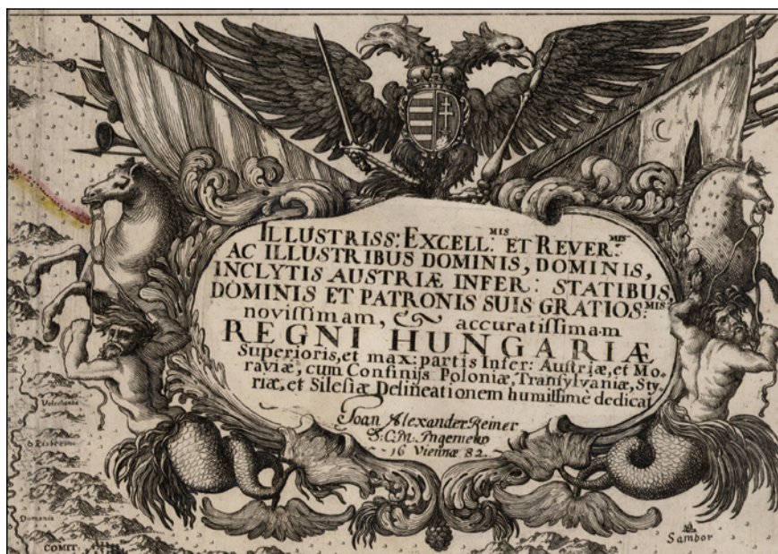
2. ábra. A Reiner-térkép OSZK-ban őrzött példányának kartusa

Pár éve a Morva Tartományi Könyvtár (Moravská Zemská Knihovna) térképgyűjteményének katalógusában megtaláltuk a térképnek egy eltérő címfeliratú példányát, majd nem sokkal később a Szász Állami és Egyetemi Könyvtár (Sächsische Landesbibliothek – Staats- und Universitätsbibliothek Dresden) állományában úgyszintén, sőt – ahogy azt majd a tanulmány