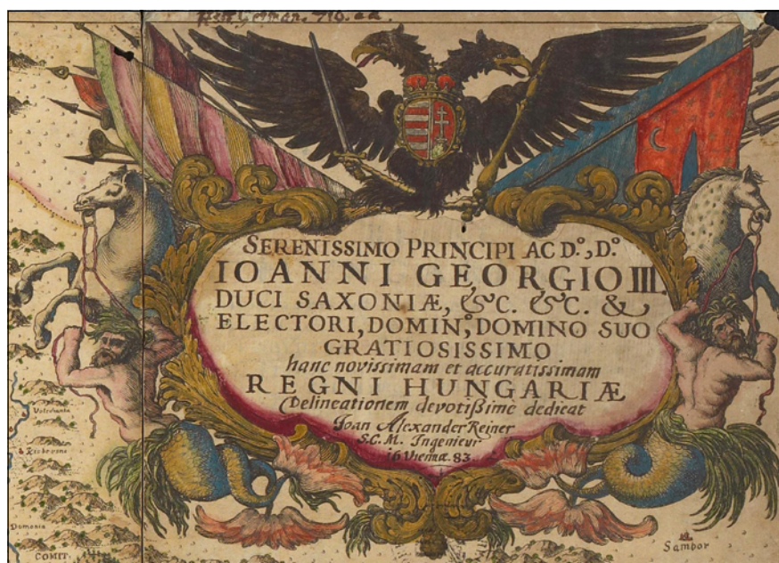
5. ábra. A Reiner-térkép drezdai második példányának kartusa (SLUB/KS, Hist. Hung. 318)

HM Hadtörténeti Intézet és Múzeum spessartin.hun@gmail.com