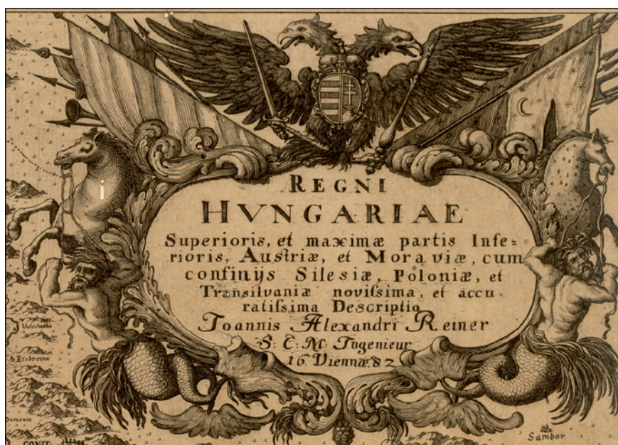
3. ábra. A Reiner-térkép brnoi példányának kartusa (MZK, Moll-0003.218)