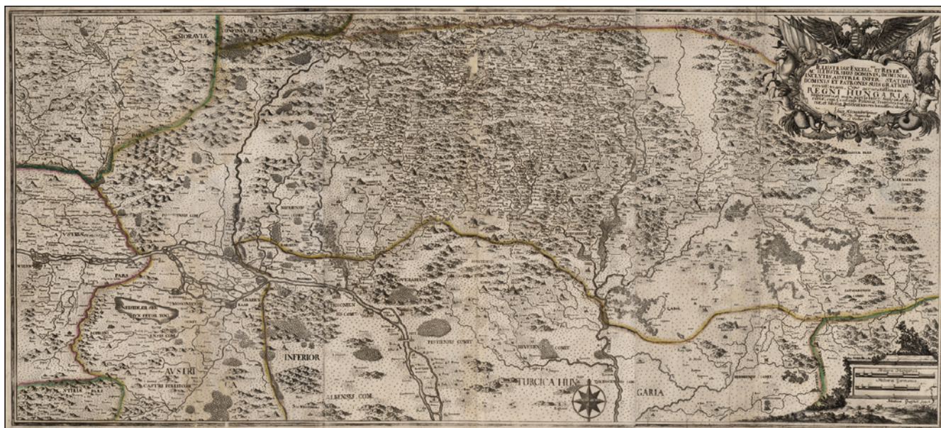
1. ábra. Johann Alexander Reiner Felső-Magyarország térképe (OSZK Térkép-, Plakát- és Kisnyomtatványtár, TR 2.965)