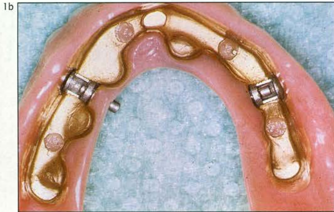
Afb. 1. Een gefreesde mesostructuur (1a), plus bijbehorende prothetische constructie (1b) op de implantaten in de edentaten bovenkaak. Er zijn drie steunpunten te onderscheiden (één in het front en twee dorsaal) waarop de overkappingsprothese stabiel kan afsteunen. Via de laterale wanden van de structuur, die onder de 4° zijn gefreesd, vindt de gegoten constructie horizontale stabiliteit. De retentie wordt verkregen via twee grendels (MK-1®) die tussen de steunpunten zijn geplaatst voor mechanische bescherming.

initieel, bij voorkeur gebruikgemaakt van een grendelsysteem om ongewenste krachten bij het uitnemen tegen te gaan. Andere attachments, zoals drukknoppen, voldoen echter ook goed.