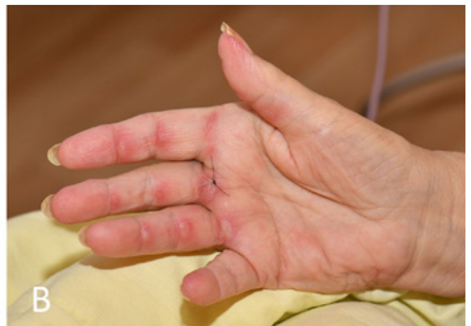
Figuur 1. Cutane kenmerken van anti-MDA5 geassocieerde dermatomyositis.

A. Op het bovenbeen rechts, gelokaliseerd ter plaatse van het 'Holster sign', een twintigtal gegroepede lenticulaire uitgeponste ulcera.