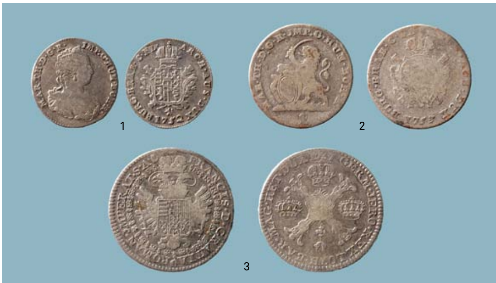
FIG. 5 Voor- en keerzijde van de munten uit de Zuidelijke Nederlanden. Maria-Theresia: 1: 1/8 ducaton (nr. 6); 2: dubbele schelling (nr. 7) en Frans I: 3: halve kroon (nr.9). Obverse and reverse of Austrian coins minted in the Southern Netherlands. Maria-Theresia: 1/8 ducaton (nr. 6); 2: dubbele schelling (nr. 7) and Frans I: halve kroon (nr. 9).