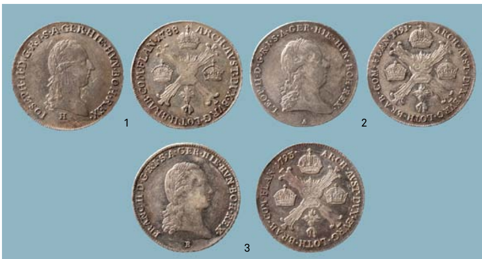
FIG. 6 Voor- en keerzijde van de munten uit Oostenrijk. Jozef II: 1: 1/4 kronenthaler (nr. 10); Leopold II: 2: 1/4 kronenthaler (nr. 16) en Frans II: 3: 1/4 kronenthaler (nr. 17). Obverse and reverse of the Austrian coins. Jozef II: 1: 1/4 kronenthaler (nr. 10); Leopold II: 2: 1/4 kronenthaler (nr. 16) and Frans II: 3: 1/4 kronenthaler (nr. 17).