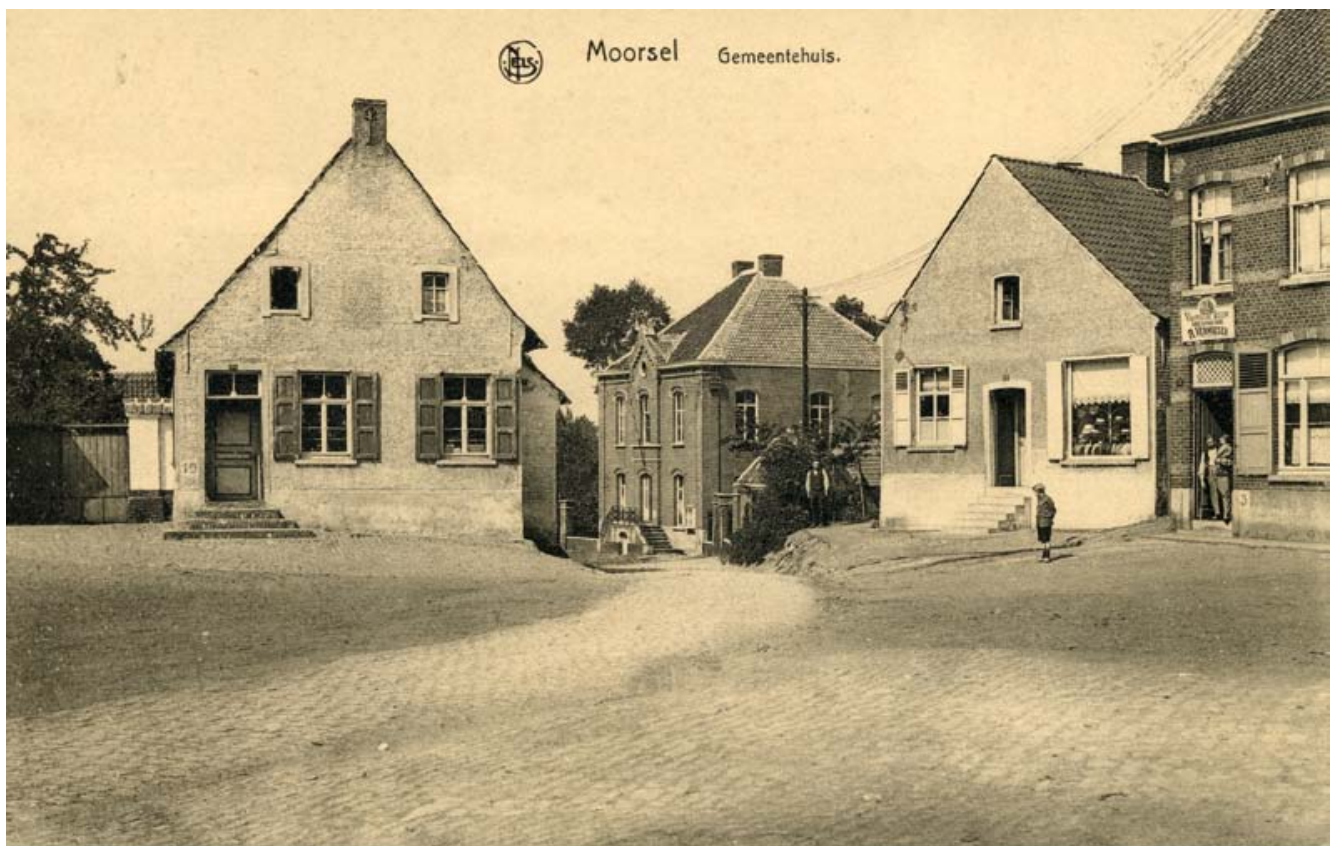
FIG. 4 Foto van de vindplaats ca. 1920, links de inmiddels afgebroken woning. Picture of the find-spot ca 1920, on the left the demolished house.

De tweede reeks, met munten uit Oostenrijk, is gelimiteerd tot een looptijd van vijf jaar, namelijk van 1788 tot 1793. Dit blok bevat munten uit de regering van Jozef II (1780-1790), Leopold II (1790-1792) en Frans II (1792-1797).