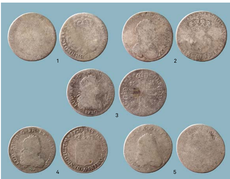
FIG. 7 Voor- en keerzijde van de munten uit Frankrijk. Lodewijk XV. 1: 1/4 écu aux trois couronnes (nr. 18); 2: 1/4 écu vertugadin (nr. 19); 3: Petit Louis d'argent (nr. 20); 4: 1/3 écu de France of zilveren Louis (nr. 22) en 5: overslag van 1/3 écu de France op Petit Louis d'argent (nr. 29). Obverse and reverse of the coins minted in France. Louis XV. 1: 1/4 écu aux trois couronnes (nr. 18); 2: 1/4 écu vertugadin (nr. 19); 3: Petit Louis d'argent (nr. 20); 4: 1/3 écu de France or silver Louis (nr. 22) en 5: overstruck: 1/3 écu de France on Petit Louis d'argent (nr. 29).