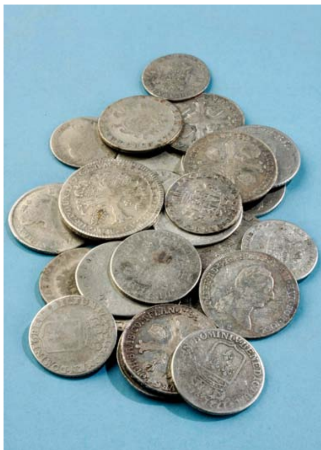
FIG. 1 Muntdepot uit Moorsel. The coin deposit from Moorsel.