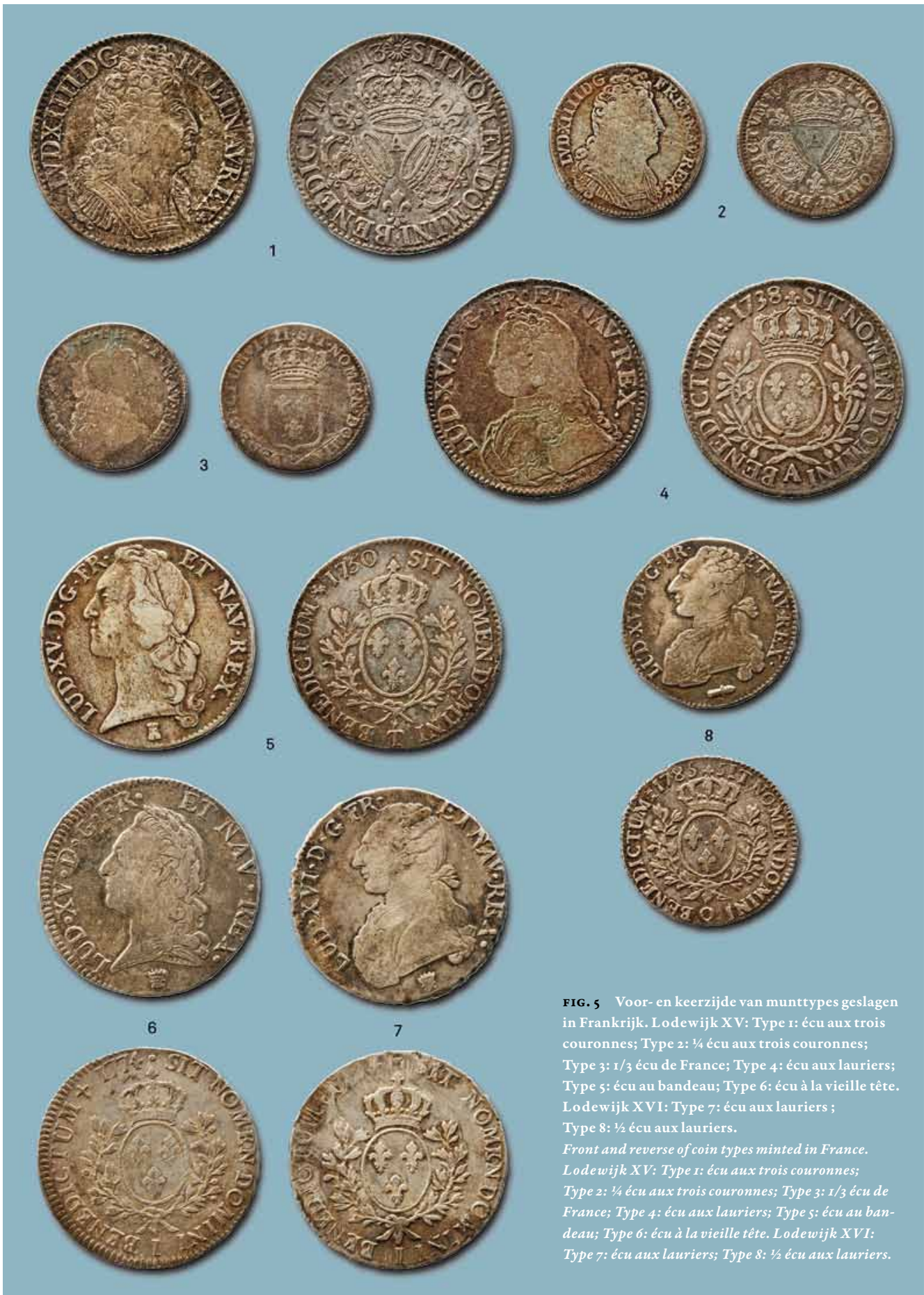
FIG. 5 Voor- en keerzijde van munttypes geslagen in Frankrijk. Lodewijk XV: Type 1: écu aux trois couronnes; Type 2: ¼ écu aux trois couronnes; Type 3: 1/3 écu de France; Type 4: écu aux lauriers; Type 5: écu au bandeau; Type 6: écu à la vieille tête. Lodewijk XVI: Type 7: écu aux lauriers; Type 8: ½ écu aux lauriers. Front and reverse of coin types minted in France. Lodewijk XV: Type 1: écu aux trois couronnes; Type 2: ¼ écu aux trois couronnes; Type 3: 1/3 écu de France; Type 4: écu aux lauriers; Type 5: écu au bandeau; Type 6: écu à la vieille tête. Lodewijk XVI: Type 7: écu aux lauriers; Type 8: ½ écu aux lauriers.