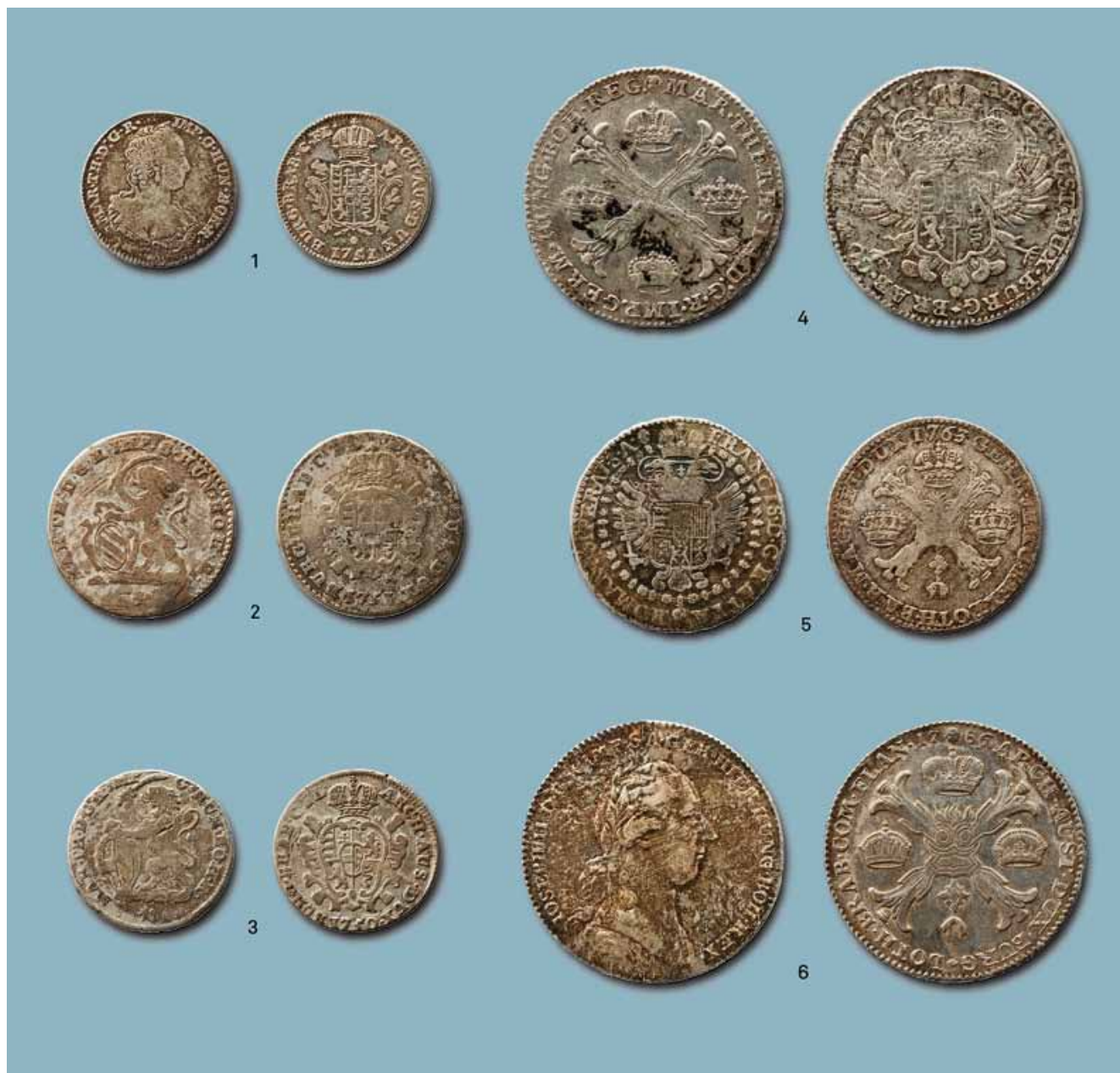
FIG. 3 Voor- en keerzijde van de Oostenrijkse munttypes geslagen in de Zuidelijke Nederlanden. Maria-Theresia: Type 1: 1/8 ducaton; Type 2: dubbele schelling; Type 3: schelling; Type 4: kroon. Frans I: Type 5: halve kroon. Jozef II: Type 6: kroon. Front and reverse of Austrian coin types minted in the Southern Netherlands. Maria-Theresia: Type 1: 1/8 ducaton; Type 2: double schelling; Type 3: schelling; Type 4: kroon. Frans I: Type 5: halve kroon. Jozef II: Type 6: kroon.