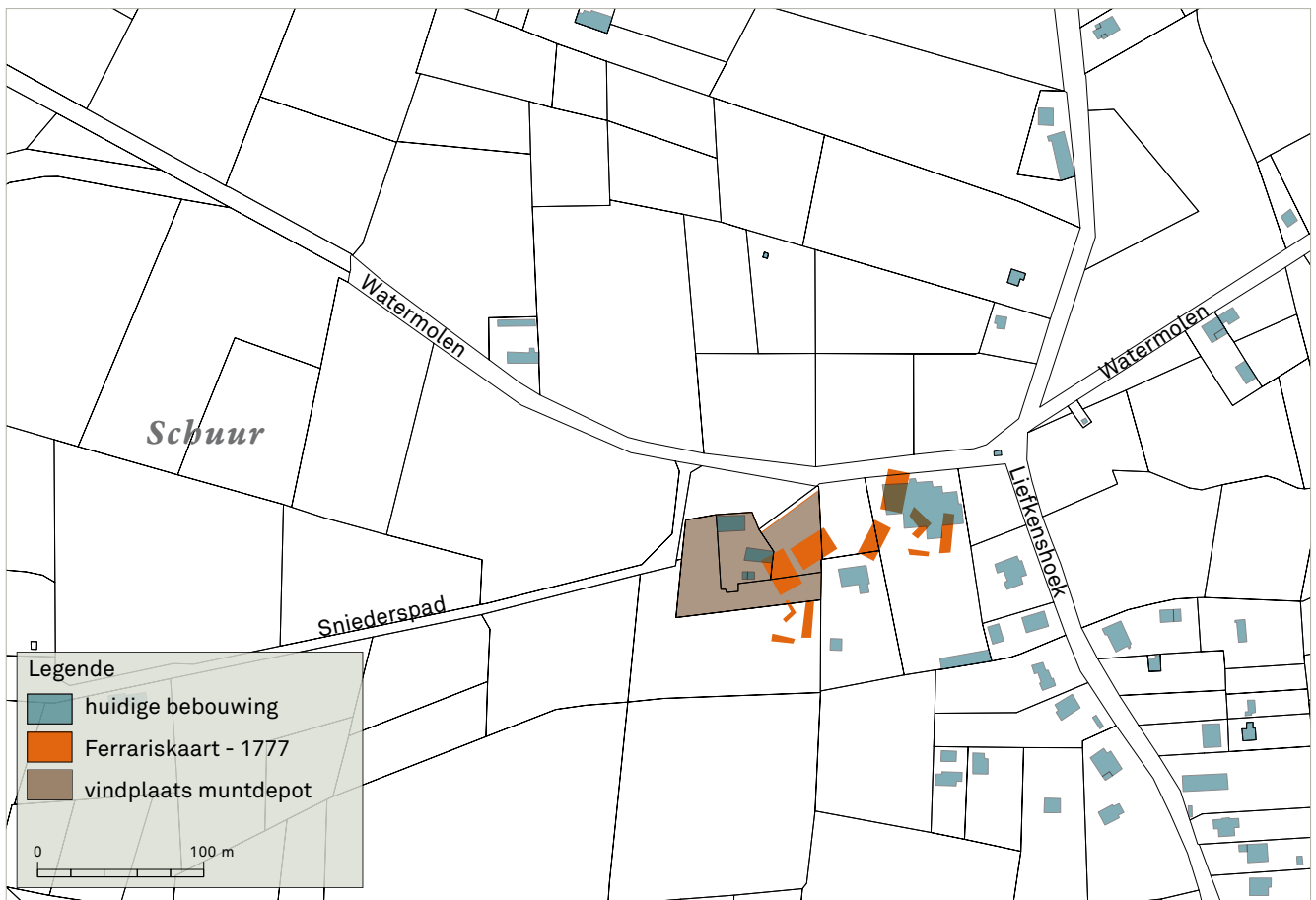
FIG. 2 Kadastraal plan van vindplaats en omgeving met projectie van de woonerven zichtbaar op de kaart van Ferraris uit 1777. Cadastral plan of the find-spot and the surrounding area; the residential areas visible on the 1777 Ferraris map have been projected on to the modern map.