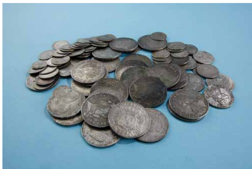
FIG. 1 Muntdepot uit Zoersel. The coin hoard from Zoersel.

Uit het geschreven equivalent van het primitief kadaster 6 blijkt dat het perceel in 1830 toebehoorde aan de familie De Boschaert. Deze naam is nog terug te vinden op de verkoopakte