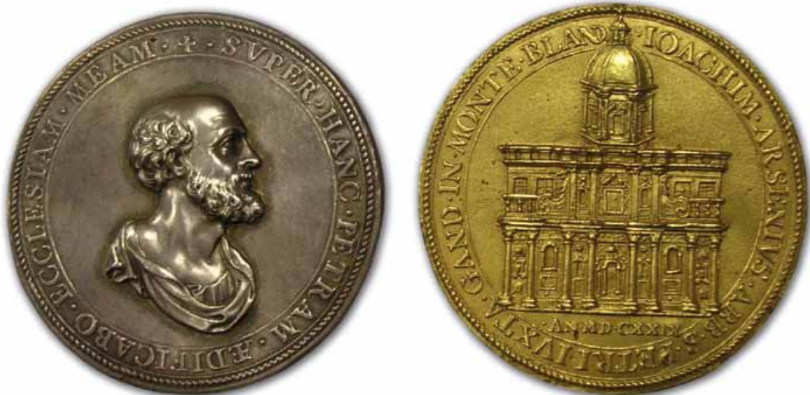
FIG. 1 Medaille geslagen ter ere van de eerstesteenlegging van de Sint-Pietersabdijkerk in Gent (1629) (Koninklijke Bibliotheek van België, Penningkabinet).

Volgens het Romeinse Pontificaal dient er bij de bouw van elke katholieke kerk - ongeacht de locatie, omvang, vorm of ontwikkeling - een plechtige eerstesteenlegging plaats te vinden. Rituele betekenisgeving is immers inherent aan deze liturgische handeling omdat ze samen met het ritueel van de inwijding de 'menselijke' constructie transformeert in een domus Dei 11 . Bij de eerstesteenlegging van de Gentse Sint-Pietersabdijkerk gaat het verband tussen het ritueel en de kerk echter verder. Dat komt onder meer door het contrareformatische 12 kader waarin de ceremonie plaatsvond. De vorige abdijkerk was immers in 1566 door beeldenstormers geplunderd en in 1580 gesloopt, 13 waardoor de eerstesteenlegging een bijkomende antiketterse symboliek in zich droeg. Veelzeggend is ook de specifieke datum die voor de ceremonie werd uitgekozen: zaterdag 14 april 1629, een dag voor Pasen 14 . De associatie tussen de verrijzenis van Jezus uit de dood en het herrijzen van de abdijkerk na de Beeldenstorm voorzag de eerstesteenlegging van een betekenisvolle inhoud.