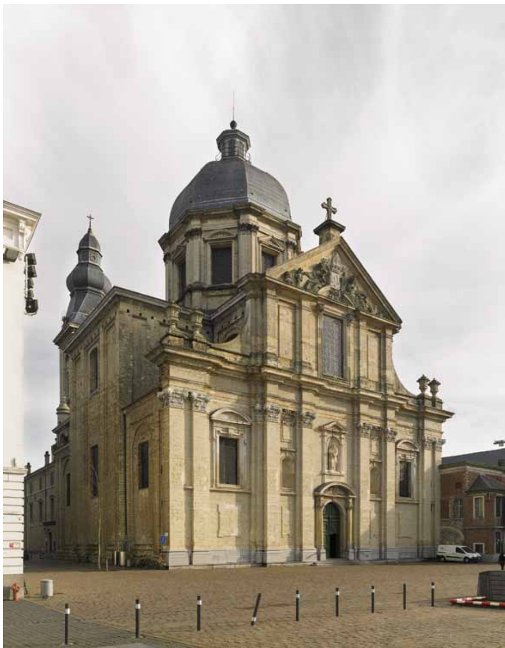
FIG. 2 Huidige kerkgevel van de Sint-Pietersabdijkerk in Gent. Present church façade of the abbey church of St Peter's in Ghent.