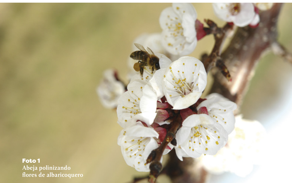
Foto 1 Abeja polinizando flores de albaricoquero