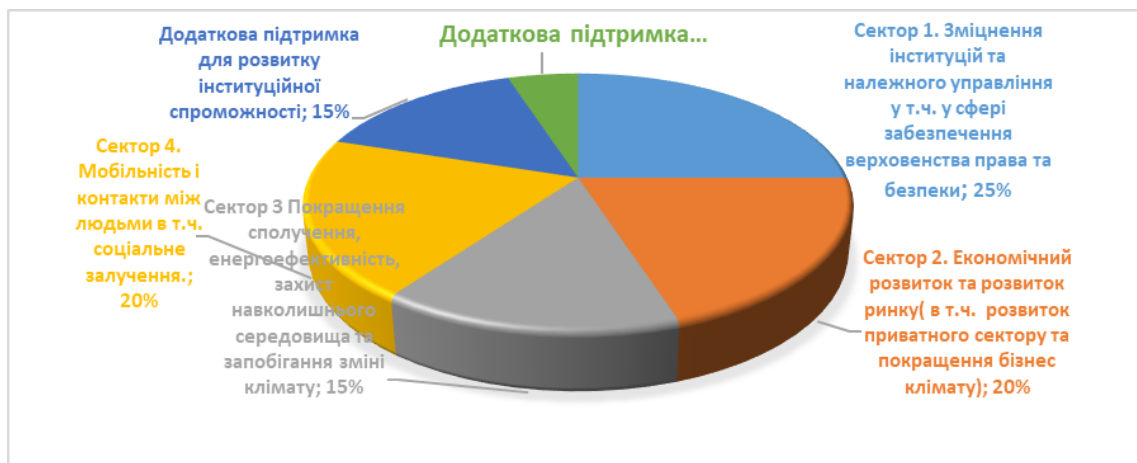
Рисунок 3. Секторальний розріз допомоги ЄС Україні за 2018–2020 роки [3]

Візуалізуємо дані таблиці 1 та представимо на рис. 3.