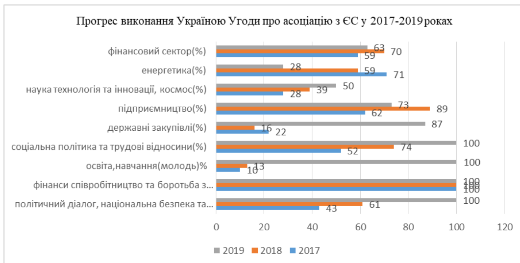
Рисунок 1. Процес виконання Україною Угоди про асоціацію з ЄС у 2017–2019 роках [4]

Виклад основного матеріалу. Аналізуючи стан євроінтеграційних процесів до подій 24.02.2022 року, Центр досліджень Разумкова оцінював такі процеси не зовсім позитивно. Дані таких досліджень представимо на рис. 1. За вказаний період були підстави стверджувати, що у відносинах Брюсселя і Києва після укладання Угоди про асоціацію й запровадження безвізу спостерігається брак спільних стратегічних цілей. З одного боку, погляд у майбутнє відносин Україна–ЄС сфокусований винятково на виконанні Угоди та її оновленні, що попри велику значущість для Києва по суті є ближчою перспективою. З іншого боку, очевидним пріоритетом для України є протистояння російській експансії, політико-дипломатична солідарність та економічна допомога ЄС. Угода про асоціацію є дороговказом і програмою українських реформ у різних секторах і галузях, а рівень її імплементації – індикатором ефективності євроінтеграційного курсу української влади. Загалом динаміка виконання Угоди за 2017–2019 рр. виглядає не надто оптимістично. Згідно зі щорічними звітами Уряду в 2017 р. загальний прогрес виконання було оцінено у 41%. У 2018 р. ситуація з імплементацією Угоди дещо покращилася – рівень виконання запланованих завдань склав 52%. Однак у 2019 р. спостерігалось уповільнення темпів – 37%. Причому Уряд виконав 53% завдань, Парламент – 12%, інші державні органи – 21% [4].