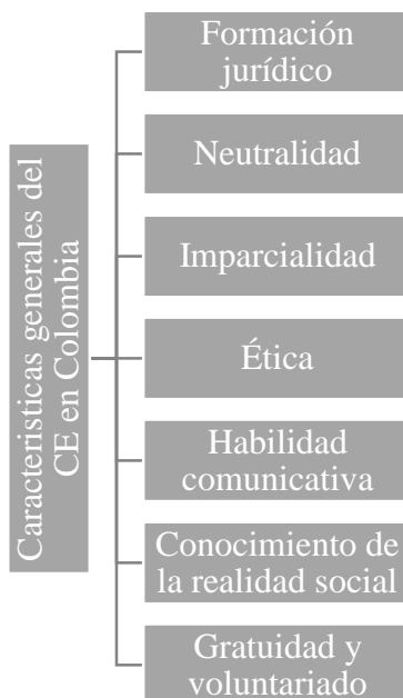
Figura 2. Características generales del FJ en Colombia

Murillo Sánchez, N.J. Gómez Duarte, T.M. (2023) Principales características del Facilitador Judicial en los países parte del Programa Interamericano de Facilitadores Judiciales (P.I.F.J.): Estudio a partir de la viabilidad en el Estado Judicial Colombiano año 2022 - 2023 . Revista IUS-Praxis, p. 1 – 12.