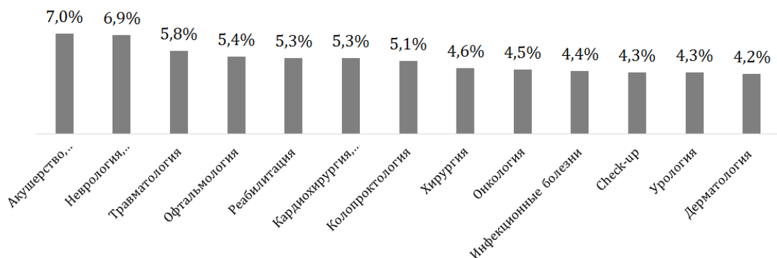
Рис. 1. Ранжирование медицинских услуг, предоставляемых медицинскими организациями для взрослой возрастной категории (в % соотношении)