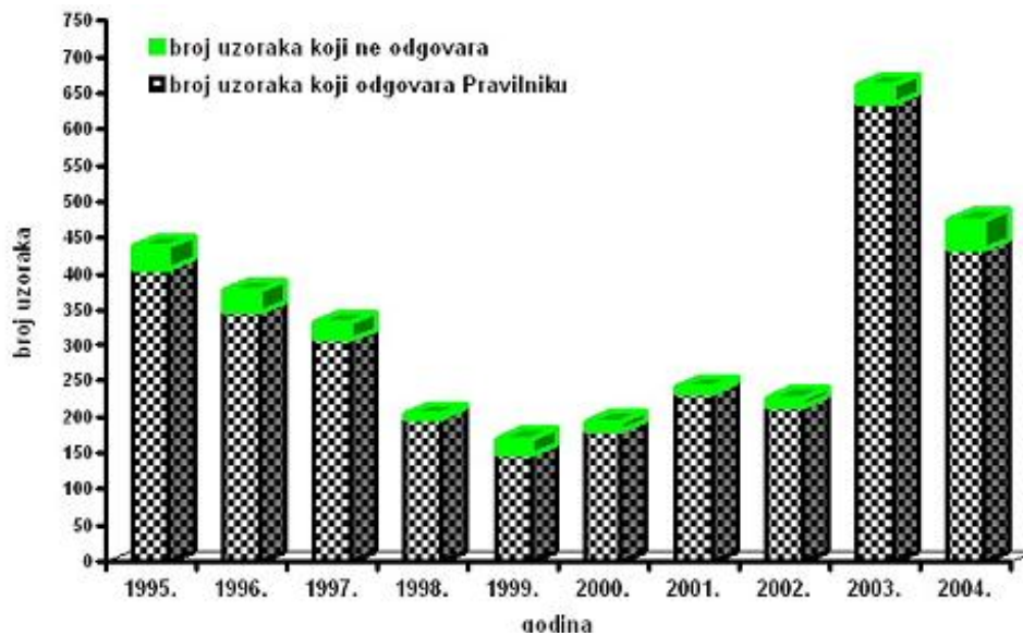
Slika 2. Prikaz broja ispitanih uzoraka predmeta opće uporabe za razdoblje 1995-2005.

Djelatnici Odjela sudjeluju u nastavi na Medicinskom i Tehnološkom fakultetu i stručnim studijima, srednjim stručnim školama, edukaciji djelatnika iz srodnih ustanova, u projektima s međunarodnom organizacijom za atomsku energiju (IAEA), u izradi zakonskih akata iz područja zdravstvene ispravnosti hrane i predmeta opće uporabe, znanstvenim odborima Hrvatske agencije za hranu i radnim skupinama za pripremu pregovora s EU (poglavlje 12).