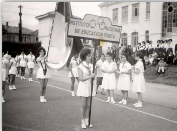
Figura 17. Comité Olímpico Colombiano.

Nacional en 1945 estableció un plan de estudios para las escuelas normales y allí se registraban tres horas de Educación Física cada semana.