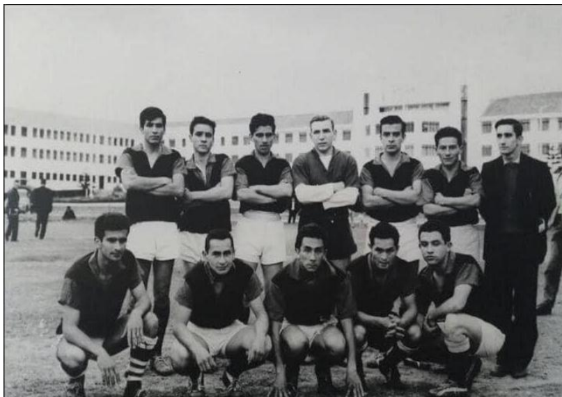
Figura 22. Primer equipo de futbol, década del 70 (no hay registro del grupo de deportistas).