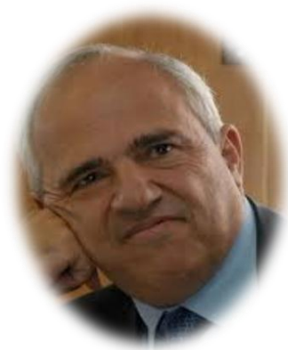
Figura 14. Ernesto Samper Pizano.