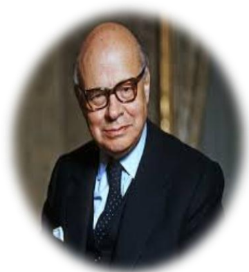
Figura 12. Carlos Lleras Restrepo.