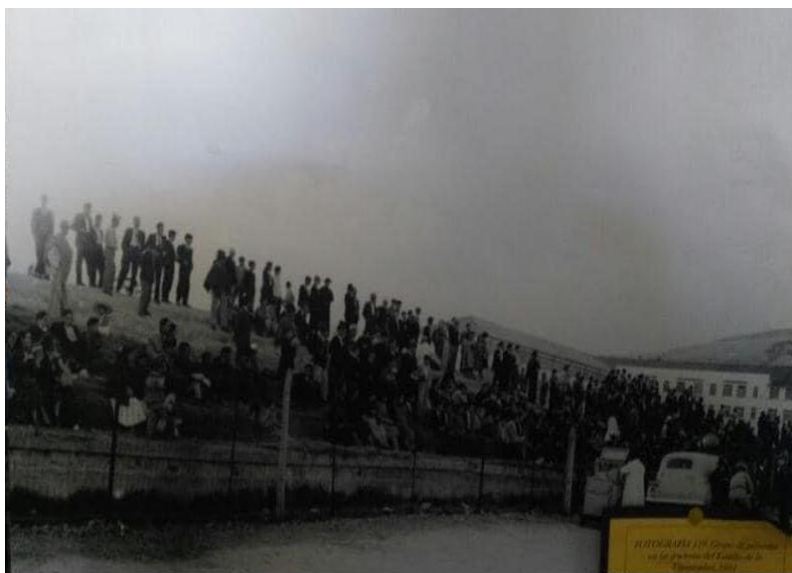
Figura 19. Pista de atletismo, década del 70.

Siente una gran satisfacción de ver en los campos deportivos, en torneos nacionales e internacionales, que sus discípulos dirigen a grandes competidores. Aconseja que se debe tener vocación de docente para ejercer esta hermosa carrera, no basta con ser un deportista, se debe ser un maestro en todo el sentido de la palabra, porque el maestro da una formación integral del cuerpo y del espíritu, también se debe tener mucha mística en la enseñanza porque nosotros como docentes, somos imagen y modelo a seguir por nuestros estudiantes.