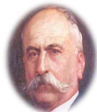
Figura 9. Pedro Nel Ospina.