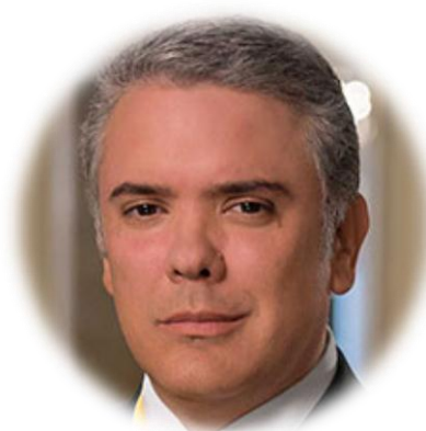
Figura 15. Iván Duque Márquez.