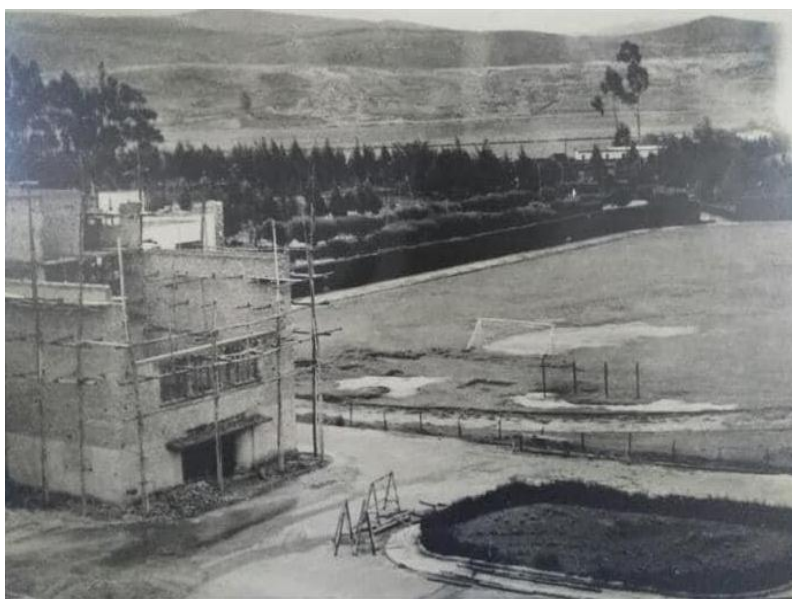
Figura 21. Cancha de fútbol, década del 70.