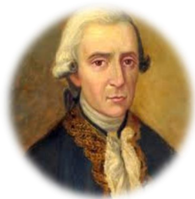
Figura 4. Francisco Antonio de Ulloa.