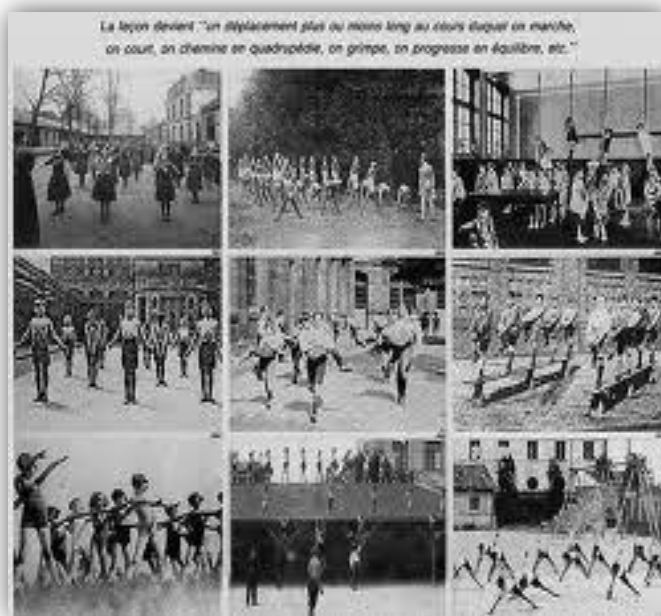
Figura 1. Escuelas gimnásticas.

preparación de la guerra y para el descanso y la recreación. Se atribuye a él la creación de ejercicios especiales para niños con incapacidades físicas.