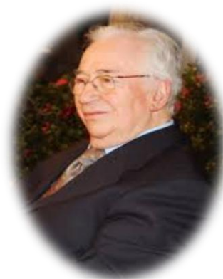
Figura 13. Belisario Betancur.