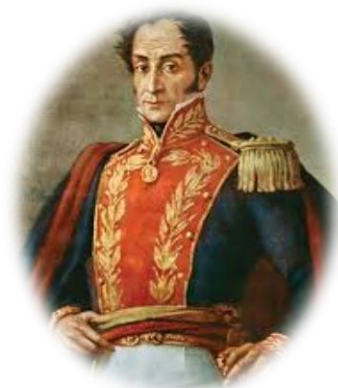
Figura 6. Simón Bolívar.