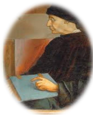
Figura 3. Vittorino Da Feltra.