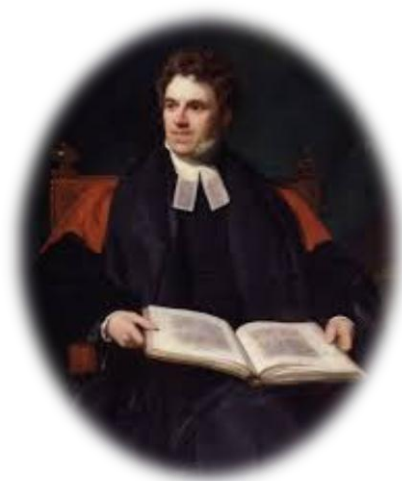
Figura 2. Thomas Arnold.