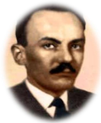
Figura 11. Alberto Lleras Camargo.