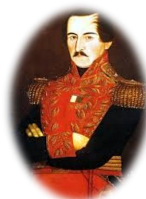
Figura 5. Francisco de Paula Santander.