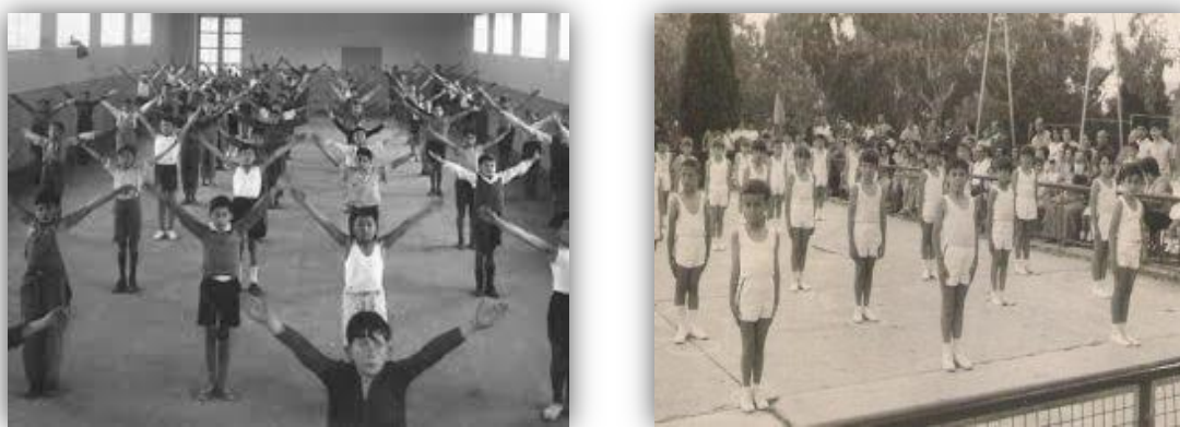
Figura 16. Incorporación de la E. F en la Escuela.

Esta visión de la educación física, ha sido el resultado de la evolución de su práctica, y de la evolución de las distintas visiones que han dado cuenta de ella. Ha existido una vinculación entre educación física y sociedad, que le ha permitido a esta rama de estudio, permear los componentes del tejido social, de tal forma que se puedan inculcar sus valores dentro de la sociedad, y que no se convierta en una materia de estudio más, haciendo que pierda el contacto con el contexto que rodea a los estudiantes.