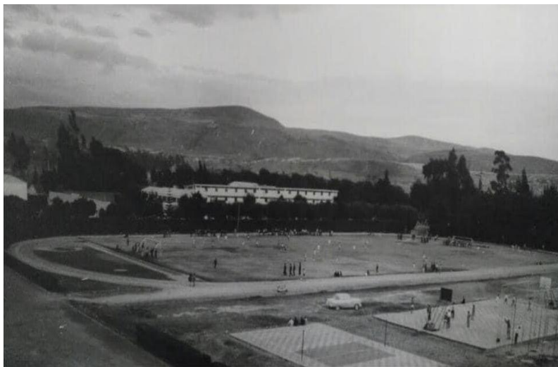
Figura 20. Canchas fútbol y baloncesto, década del 70.