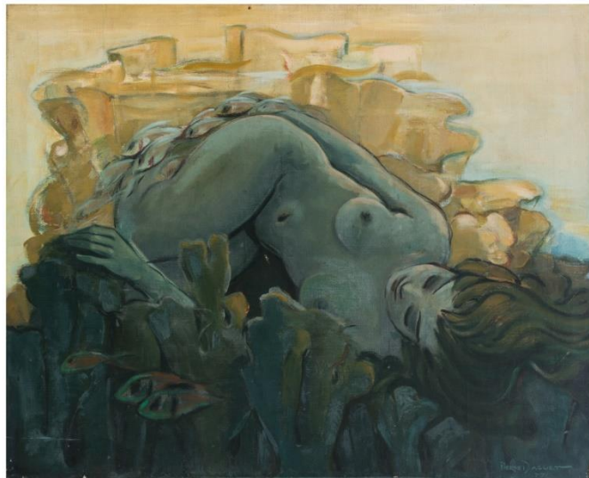
Pierre Daguet (1977) Ondina (Pintura al óleo)