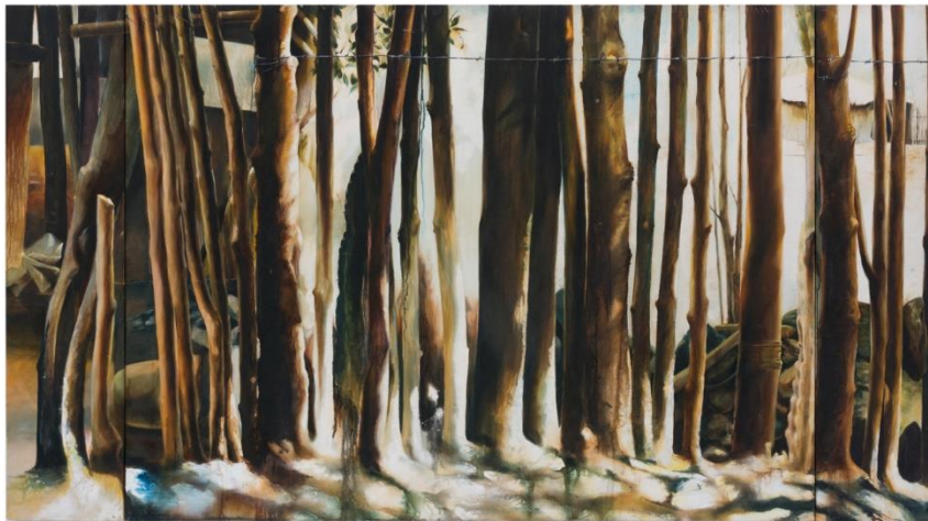
Cristo Hoyos (2002) De cerca (Pintura al óleo)