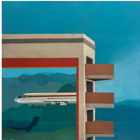
Cecilia Delgado (1974) Paisaje (Pintura en acuarela y gouache)