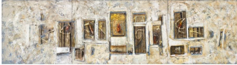
Ruby Rumié (2000) A los muertos hay que enterrarlos (Pintura acrílica)