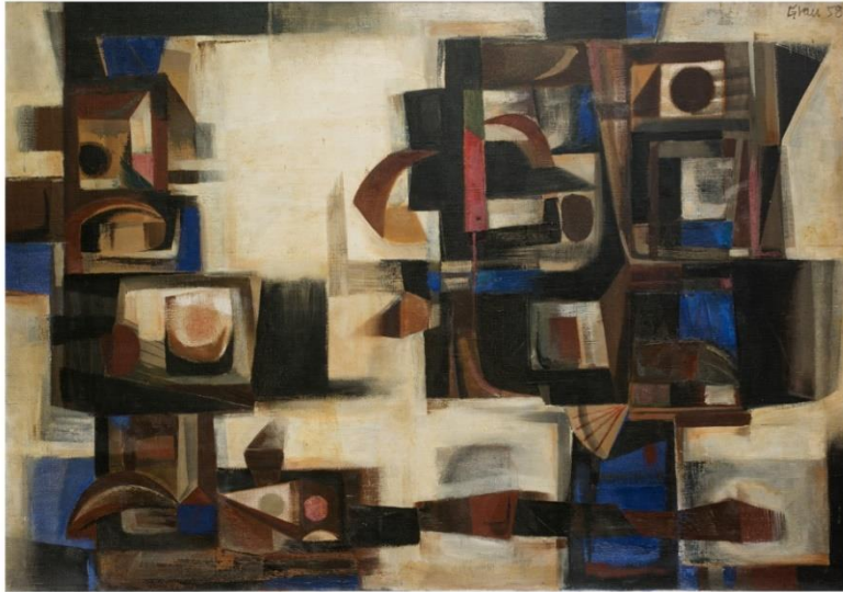
Enrique Grau (1958) Composición abstracta (pintura al óleo)