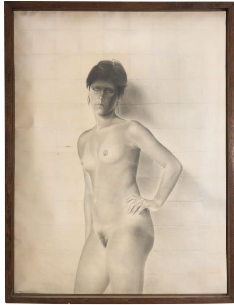
Alfredo Guerrero (1975) Desnudo femenino (dibujo. Pastel, carboncillo, puntas metálicas, lápiz)