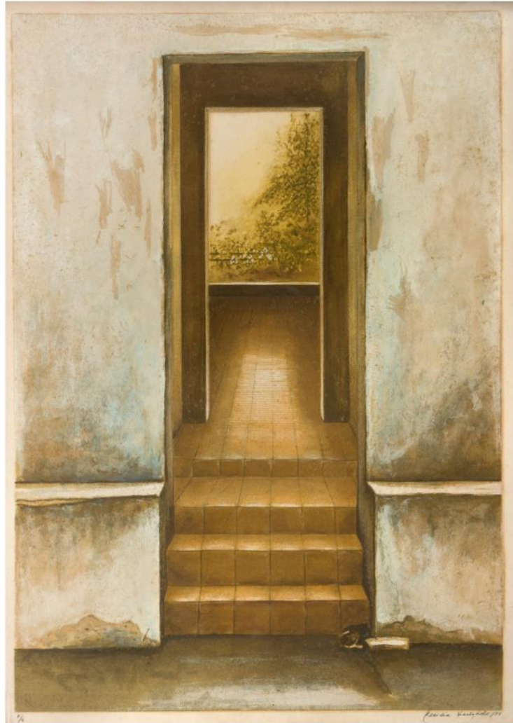
Cecilia Delgado (1988) Sin título (grabado litografía)