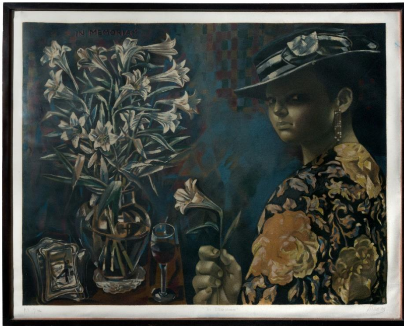
Enrique Grau (1993) In Memoriam (Grabado, serigrafía)