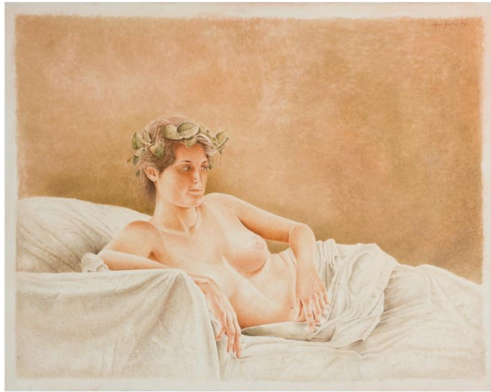
Alfredo Guerrero (2003) Desnudo (Pintura al óleo)