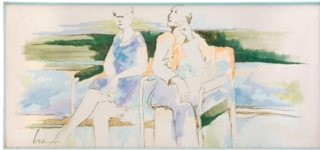
Dalmiro Lora (1982) Sin título (Pintura al óleo)