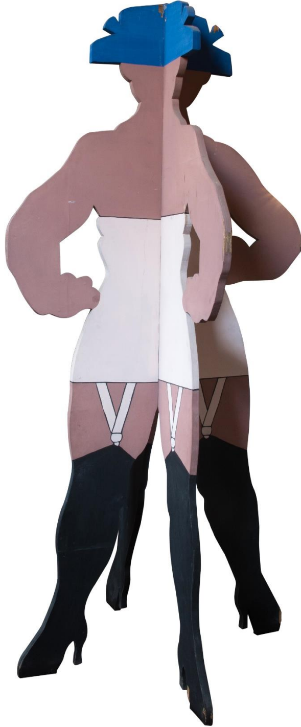
Enrique Grau Ensamblaje en madera (Escultura)