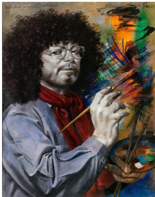
Enrique Grau (1984) Autorretrato con peluca en Nueva York (Pintura mixta)