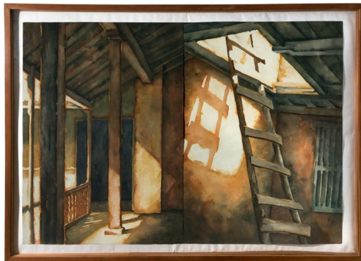
Teresa Perdomo (1995) Escisión (pintura, acuarela y gouache)