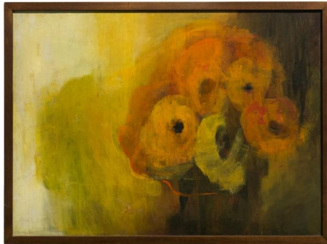
Cecilia Porras (1969) Flores amarillas (Pintura al óleo)