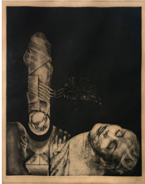
Juan Antonio Roda (1973) El delirio de las monjas muertas 5 (grabado aguafuerte)