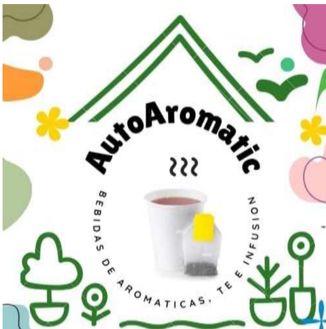
Imagen de la empresa