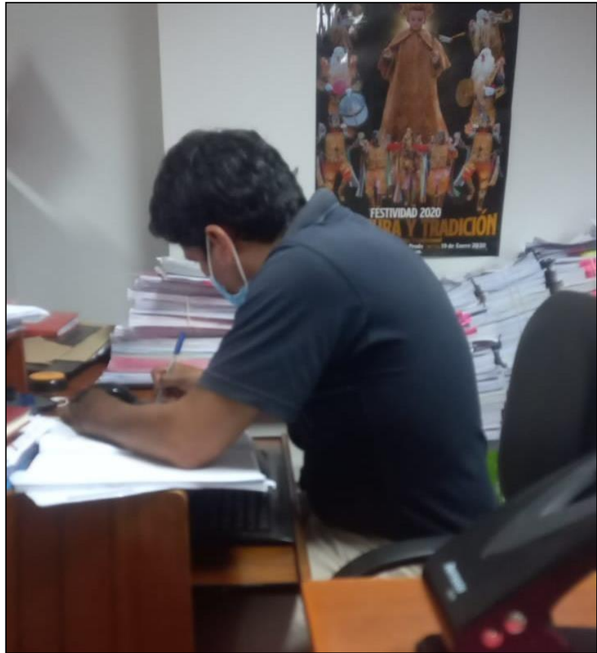
Encuesta dirigido al personal de la 4° FPPC – Huánuco.