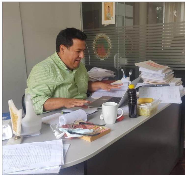
Encuesta dirigido a funcionario de la Municipalidad.