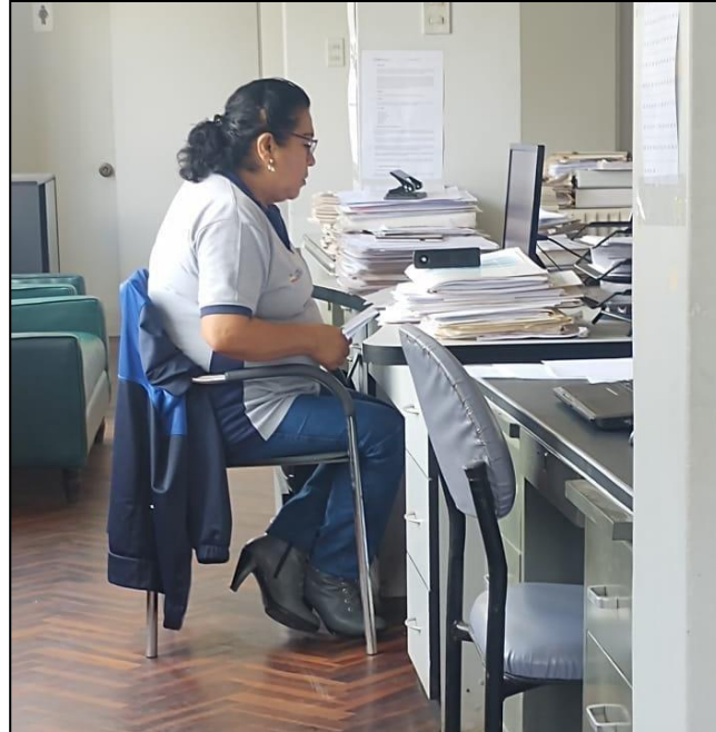
Encuesta dirigido a especialista del Juzgado Unipersonal.