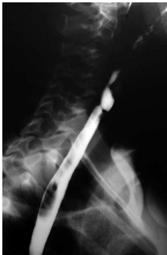
FIGURA 1. Estenosis congénita en el tercio superior