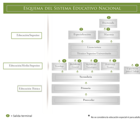
Figura No. 1 Componentes del Sistema Educativo Nacional.