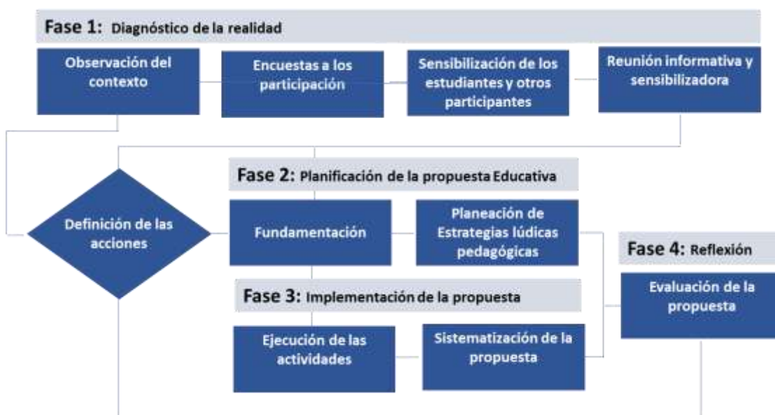
Figura 1 Configuración del diseño de investigación

En esta investigación se seleccionaron estudiantes del Centro Educativo Palpis, de la población indígena del Municipio Ricaurte- Nariño, Colombia. Se considero un muestreo por conveniencia e intereses de los investigadores que concentro en el abordaje de un grupo de diez (10) estudiantes que se encuentran cursando el cuarto grado. Se selecciona esta muestra dadas sus características y disponibilidad, siendo son grupos de interés y representativos de la comunidad.