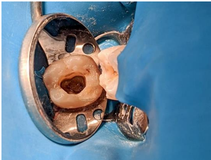
Figura 2: acesso endodôntico evidenciando canal em C