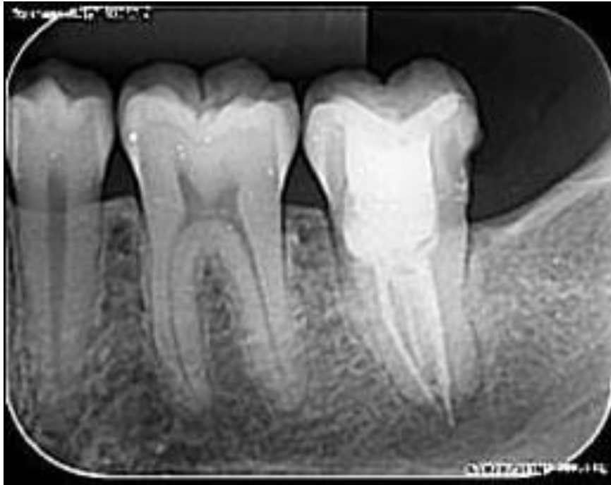
Figura 4: radiografia periapical evidenciando involução da lesão e neoformação óssea