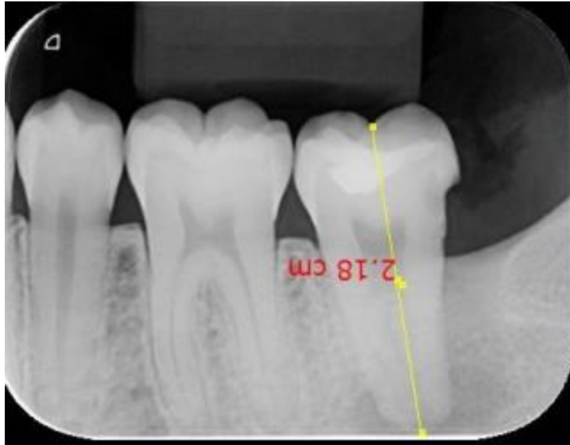
Figura 1: radiografia periapical para medição do comprimento aparente do dente