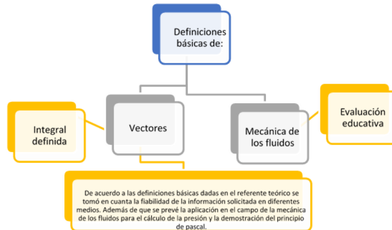
Figura 1. Aspectos teóricos para la construcción de un prototipo experimental

Algunos de los aspectos teóricos básicos que se lograron establecer de las diferentes fuentes bibliográficas consultadas son los siguientes: