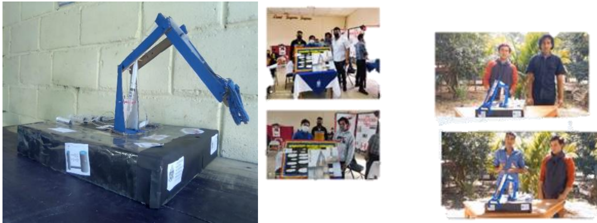
Figura 3. Prototipo final, presentación y explicación del mismo

Ahora, simplemente se pega en la estructura con silicona y que los otros extremos de los alambres encajen en los agujeros que se realizaron a las jeringas con la manguera de 70 cm (0,70 m). Para la parte final, se ejecuta la última pieza de cartón de 5 × 5 cm (0,05 × 0,05 m), se pega al lado de la estructura y se le atraviesa un palo de brocheta, luego se agrega la última jeringa con manguera de 43 cm (0,43 m). Ahora se tiene total movilidad en el brazo hidráulico, aunque al principio cuesta aprender a movilizarlo. Es fácil y divertido.