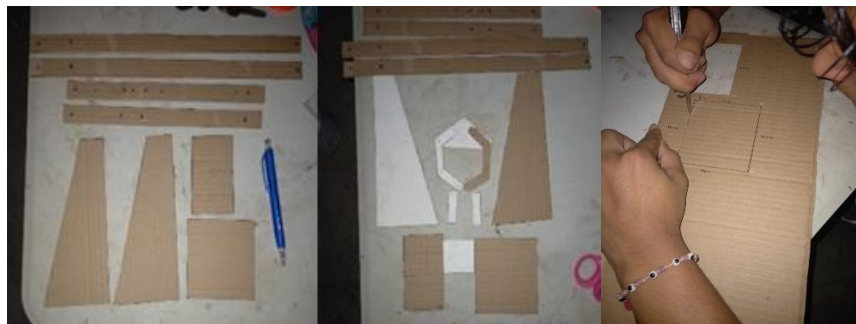
Figura 2. Estructura para la elaboración del trabajo práctico experimental

Para la construcción del prototipo experimental que demostrara el principio de Pascal se siguieron diversos pasos. En primer lugar, se consideró cómo se podría demostrar dicho principio en el artefacto. Asimismo, se tuvo en cuenta las medidas necesarias para la elaboración del brazo, la muñeca y la base que fijaría el prototipo, teniendo presente la morfología de la robótica.