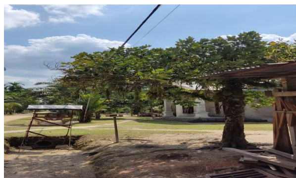
Gambar 2. Kegiatan observasi buah nangka di RT 03 Desa Buluh Rampai, Kecamatan Seberida

Berdasarkan hasil observasi dapat disimpulkan bahwa permasalahan yang muncul adalah kurangnya inovasi dan pengembangan di bidang pembuatan marmalade menjadi produk terbaru. Masalah selanjutnya adalah kurangnya edukasi masyarakat tentang pengolahan nangka lebih lanjut. Ini mengarah pada fakta bahwa nangka dikonsumsi begitu saja.