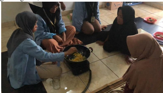
Gambar 4. Introduksi inovasi pengolahan buah nangka dan penjelasan prosedur pengolahan

Kegiatan pengenalan juga dilakukan melalui sosialisasi bahan dan alat yang dibutuhkan dalam proses pembuatan marmalade nangka. Bahan yang dibutuhkan untuk membuat marmalade terdiri dari buah nangka sebagai bahan baku utama, gula pasir dan air. Prosedur pembuatan marmalade yang pertama adalah buah nangka dibelah menjadi tiga bagian sebanyak 16 buah. Gula ditimbang sebanyak 300 g dan ukur air sebanyak 200 mL. Nangka yang sudah dipotong lalu dicuci dengan air mengalir. Air dimasukkan ke dalam panci tunggu hingga mendidih, setelah mendidih masukkan gula yang telah ditimbang lalu aduk gula hingga larut. Nangka dimasukkan setelah gula larut dan diaduk selama 10 menit. Masukkan ke dalam gelas jar dan tunggu hingga mendingin kemudian ditutup dan biarkan semalaman. Setelah didiamkan semalaman lalu masak produk setengah jadi hingga mengental, kemudian setelah masak didiamkan selama satu minggu.