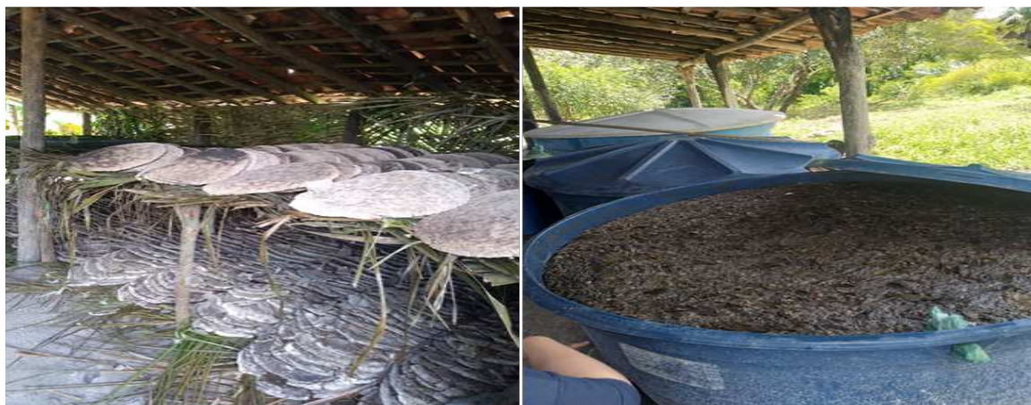
Figura 4 – À esquerda, beijos em processo de emboloramento sobre jirau. À direita, caixas de PVC utilizadas como dornas de fermentação para os beijos triturados e misturados em água. Ambas as fotos foram obtidas em uma visita realizada em um alambique do Povoado Cajueiro, município de Urbano Santos