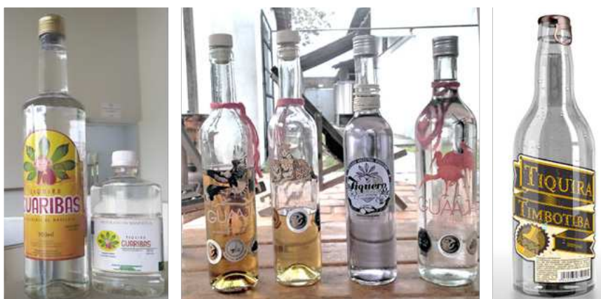
Figura 6 – Da esquerda para a direita, apresentam-se as Tiquiras Guaribas, Guaaja e Timbotiba, as únicas com registro junto ao MAPA