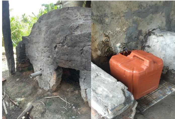
Figura 5 – Processo de alambicagem da Tiquira, realizado geralmente em recipientes de cobre e recobertos de tijolos e barro. À esquerda, apresenta-se a parte de trás do alambique, onde a lenha é queimada. O cano aí apresentado é destinado à saída da vinhaça. À direita, a Tiquira é coletada em galão de 20 L