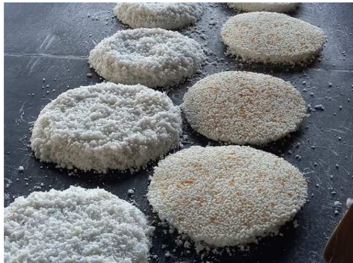
Figura 3 – Beijus de mandioca sendo assados em chapas aquecidas entre 70°C e 80°C, no Povoado São Domingos, município de Santana do Maranhão