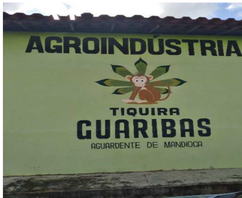
Figura 7 – Sede da Agroindústria da Aguardente Tiquira pertencente à Cooperativa COOPTAF-Guaribas, no município de Urbano Santos, MA

Porém, para que isso aconteça, é necessário garantir apoio das mais diversas esferas para a COOPTAF-Guaribas. Algumas ações já estão sendo realizadas com o apoio do Sebrae, Confederação da Agricultura e Pecuária do Brasil (SENAR) e o Sindicato da Indústria de Bebidas, Refrigerantes, Água Mineral e Aguardente do Estado do Maranhão (SINDIBEBIDAS), com ofertas de cursos, participações em feiras e apoio na agroindústria.