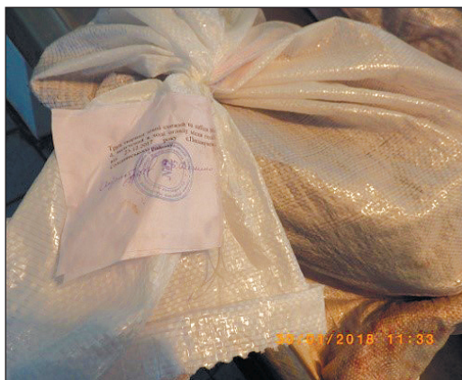
Рис. 3. Упакований об'єкт судово-ветеринарного дослідження із виконаним на папері пояснювальним написом

рис. 3—4), ідентифікаційний код (який відповідає ідентифікаційному коду акта відбору зразків і дає змогу ідентифікувати партію (частину партії) кормів (кормових добавок) для тварин, від якої (яких) відібрано зразки); укладають акт відбору зразків і зазначають про це у протоколі огляду місця події. Порядок відбирання зразків і речей у кримінальному провадженні встановлено за положеннями про тимчасовий доступ до речей і документів (ст. 160—166 КПК 82 ).