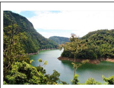
Embalse de Amaní. Norcasia, Caldas. Carlos A Tamayo. 2021.