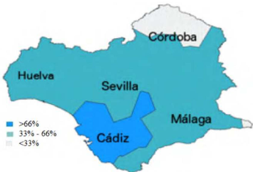
Mapa 3. Nivelación en ustedes en la actualidad (Lara Bermejo 2018).