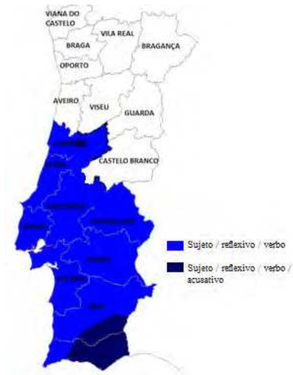
Mapa 7. Nivelación en vocês y su flexión a inicios de 1900 (Lara Bermejo 2018).

La elección del tratamiento y la satisfacción pragmática están constreñidas a una sociedad dada, entendida esta como la de un país concreto. En este sentido, las convergencias o divergencias lingüísticas suelen ser irrelevantes. Aunque España exhiba varias áreas lingüísticas, en todas ellas impera el mismo sistema de cortesía, encarnado en la solidaridad como concepción no marcada de las relaciones interpersonales. Incluso la selección de los pronombres en gallego, catalán y español para la solidaridad pragmática es la misma, ya que se trata de un rasgo de España y no de la lengua. Sin embargo, aunque Argentina y España compartan el español como lengua, las opciones pronominales son completamente diversas.