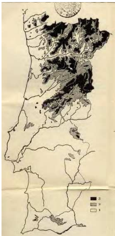
Mapa 9. Relieve de Portugal (Ribeiro 1986).