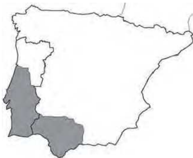
Mapa 1. Sprachbund suroccidental de la Península Ibérica (Lara Bermejo 2020a).

guesa en ambas direcciones; no obstante, el acervo común que la denominada raya pueda tener es un factor que no necesariamente está relacionado con la taxonomía del Sprachbund . Los préstamos transfronterizos son comunes en todo límite lingüístico y político, pero el léxico apuntado por la autora cobra relevancia porque se trata de una serie de voces que han trascendido más allá de las zonas que circundan la frontera. En el caso de Andalucía, alcanzan hasta prácticamente el centro de la región, mientras que en Portugal se difunden por todo el territorio continental hasta arribar a la célebre isoglosa que divide las variedades septentrionales y meridionales, alrededor de la cuenca del río Mondego.