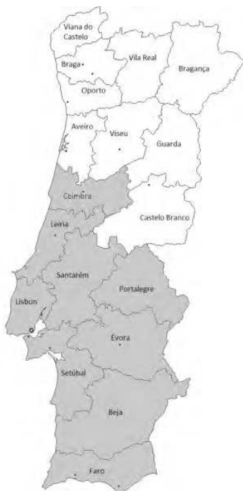
Mapa 4. Nivelación en vocês a inicios de 1900.