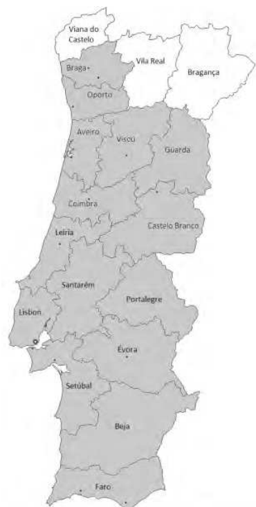
Mapa 6. Nivelación en vocês en la actualidad.