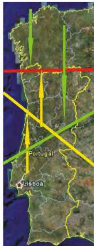
Mapa 10. Difusión geolingüística del portugués europeo (Álvarez Blanco 2015).

De acuerdo con la autora, las innovaciones, ya sean de un lado o de otro, se propagan con mayor rapidez por la costa y les cuesta más imponerse en el interior y en zonas muy rurales por la falta de comunicación y la propia orografía.