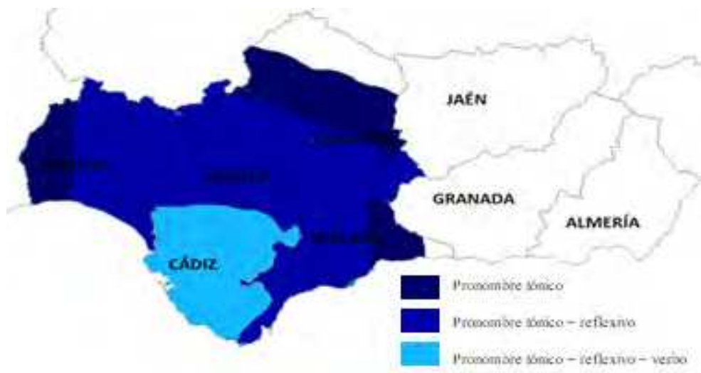
Mapa 2. Nivelación en ustedes a inicios de 1900 (Lara Bermejo 2018).