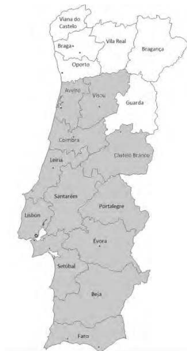
Mapa 5. Nivelación en vocês hasta el tercer cuarto de 1900.

El mapa 7 describe la situación de principios de la centuria de 1900. De acuerdo con el mismo, hace cien años, la 3 pl. se había establecido en reflexivo y verbo, aunque había saltado también al objeto directo, si bien esta última posibilidad únicamente se documentaba en el extremo oriental del Algarve y el sureste del Alentejo, justo en la frontera con Andalucía occidental. El mapa 8, no obstante, da cuenta de todo el contínuum por el que pasa la 3 pl., el cual coincide con el formulado en (i). Desde el punto de vista geolingüístico, observamos que la 3 pl. se halla más extendida en el sureste del Alentejo y el extremo oriental del Algarve, siendo de nuevo la región más innovadora en el comportamiento sintáctico de la nivelación. En resumen, el epicentro de la nivelación en Andalucía es el eje Cádiz-Sevilla, mientras que en Portugal lo representa el sureste del Alentejo y el extremo oriental del Algarve. Además, el modelo de difusión responde al contagio por ondas, basado a su vez en el establecimiento de la 3 pl. en todos los elementos flexivos de manera implicativa, siguiendo el esquema de (i).