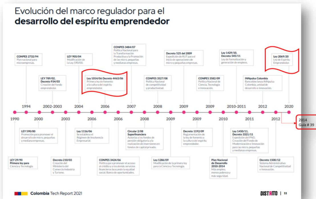
Figura 2. Evolución del marco regulatorio para el desarrollo del espíritu emprendedor