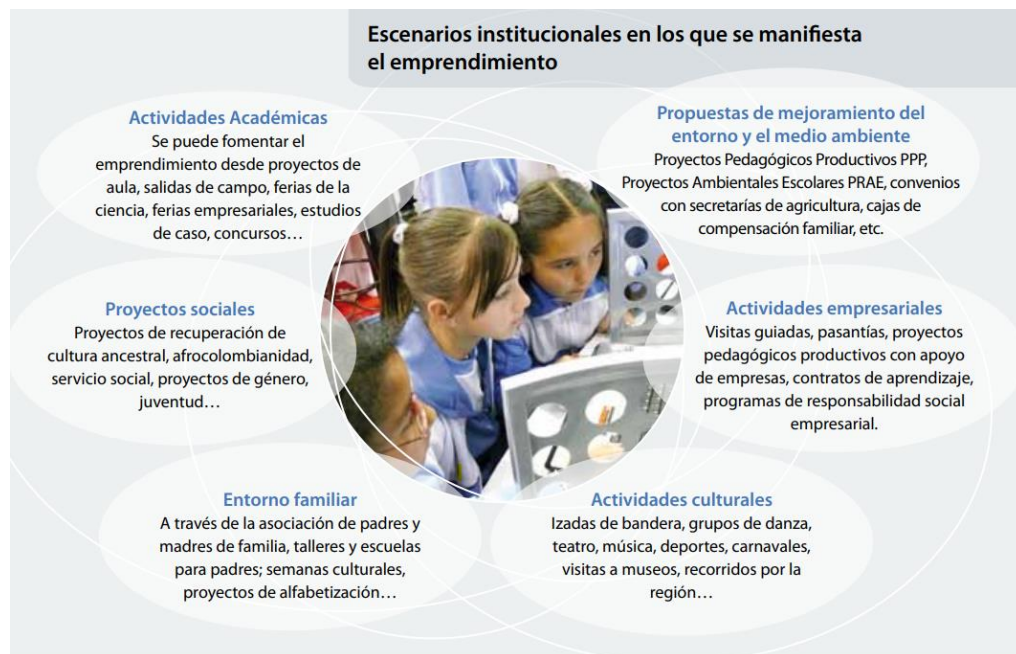
Figura 4 Escenarios institucionales en los que se manifiesta el emprendimiento