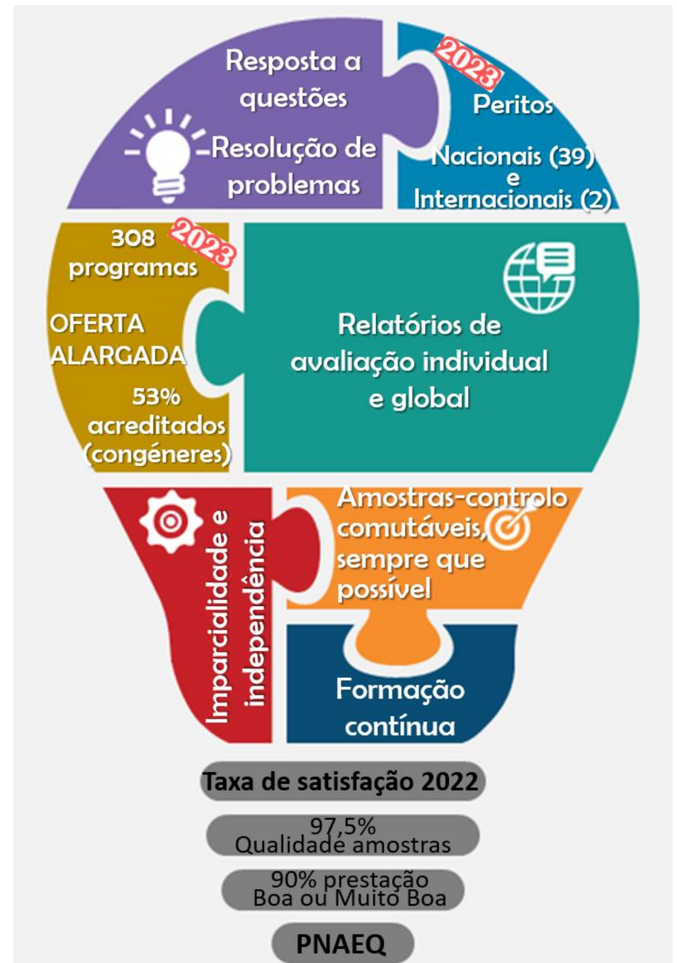
Figura 2 – Esquema resumo representativo das vantagens de participação no Programa Nacional de Avaliação Externa da Qualidade (PNAEQ)

As vantagens da participação no PNAEQ estão descritas na Figura 2: