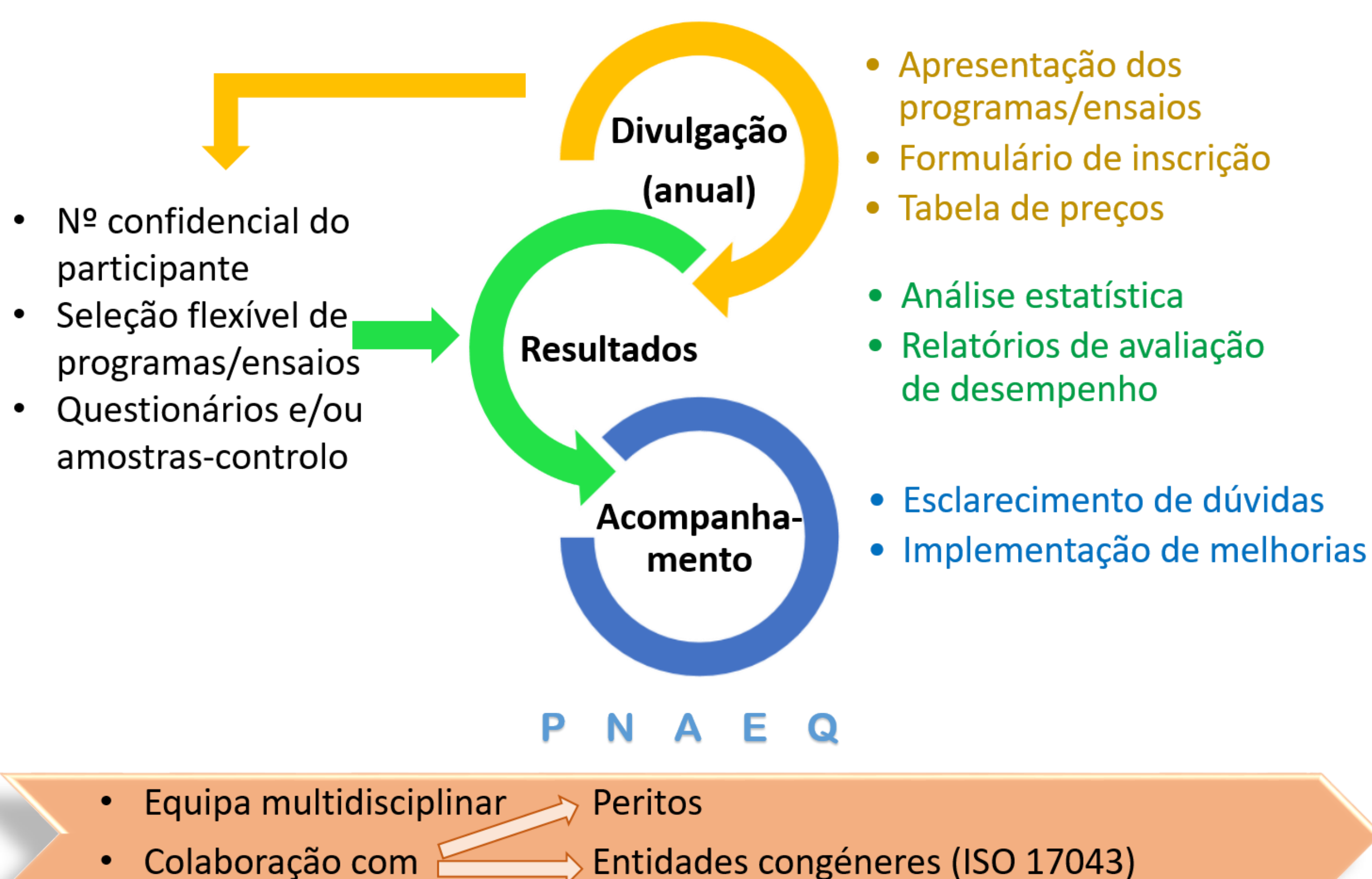
Figura 1 – Esquema resumo representativo do funcionamento do Programa Nacional de Avaliação Externa da Qualidade (PNAEQ)

A equipa do PNAEQ é multidisciplinar e colabora com peritos e entidades congéneres que estão vinculados aos deveres de ética e independência. As entidades congéneres estão acreditadas pela ISO 17043 para a maioria dos programas (Figura 1)