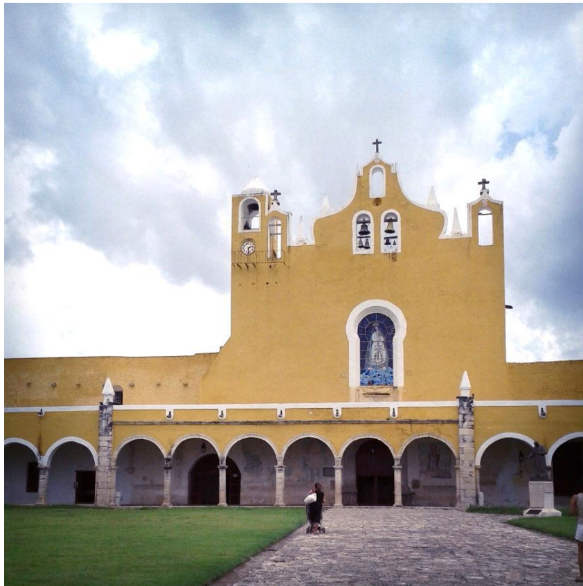
Foto Ex Convento de San Antonio de Padua en Izamal, Yucatán. 32

En Yucatán aún no se tiene fijado la mirada para el estudio del turismo religioso, como se ha hecho en otras áreas como el turismo de playa o de arqueología. Y siguiendo los antecedentes que se tienen sobre esta línea en otros estados de México, se considera que es preciso iniciar las aproximaciones académicas a esta área de la península.