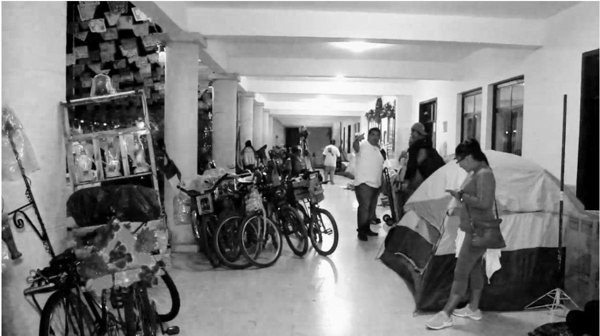
Peregrinos en los bajos del palacio municipal de Tizimín. 21

Tomando en cuenta lo anterior en su análisis Shadow y Rodríguez Shadow (1994) hacen referencia a que en el peregrinaje se da lugar a una vida radicalmente distinta a la normal que surge durante el flujo de los peregrinos hacia el santuario. Que se caracteriza por el compañerismo, por la igualdad y la ausencia de jerarquía impuesta. De esto último se puede relacionar que el peregrinar que los jóvenes hacen hacia el santuario de los Reyes Magos, les brinda un espacio para estar lejos de casa y de las reglas familiares, pudiendo así vivir una aventura en carretera. Esa forma parte de una de las motivaciones por las que este grupo de personas deciden realizar este ritual peregrino. Muy distinto a lo mencionado líneas arriba, sobre la libre decisión de realizar la práctica para el cumplimiento de la promesa.