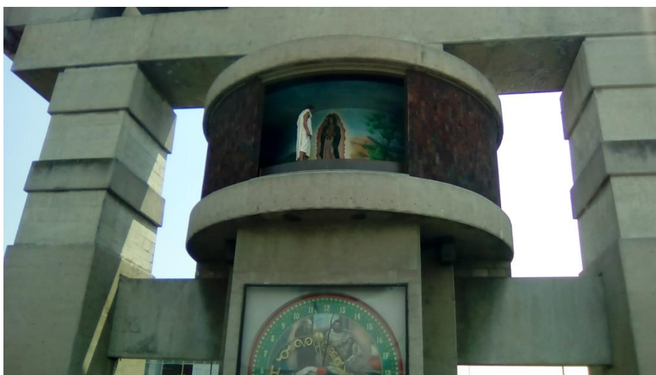
Representación de la aparición de la virgen de Guadalupe a Juan Diego 28

La basílica de Guadalupe en la Ciudad de México es un punto importante de expresión religiosa que se conjuga con el turismo. Diariamente recibe miles de visitantes y la manera en la que está conformado el recinto, da lugar a que el recorrido te pueda llevar algunas horas. Cuenta con diversas capillas en las que se suscitaron diferentes acontecimientos que forman parte de la historia de la iglesia católica mexicana. Cuenta con museos y tiendas de recuerdos religiosos oficiales (los que están dentro del recinto) y los puestos y plazas que se encuentran fuera.