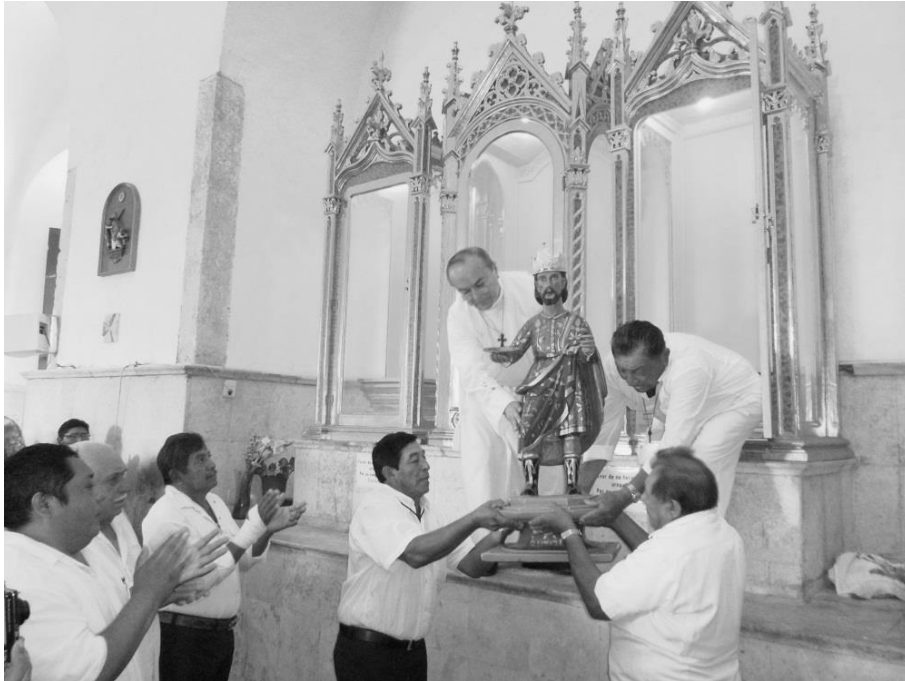
Bajada de los Reyes Magos 23

“GASPAR, MELCHOR Y BALTAZAR FUERON BAJADOS HOY DE SUS NICHOS PARA SER PUESTOS FRENTE AL ALTAR MAYOR DE LA IGLESIA EDIFICADA EN SU HONOR, DONDE ESPERAN LA VISITA DE MÁS DE 500 MIL PERSONAS EN LOS PRÓXIMOS 20 DÍAS.” 22